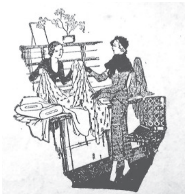
IMAGEN 2 21

21 MUNDO ARGENTINO, 25 jul. 1934, p. 29.