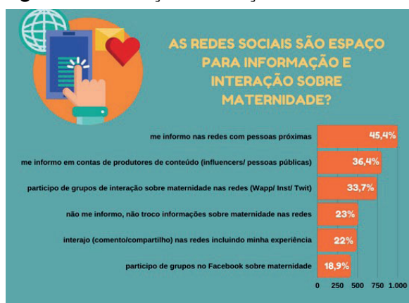
Figura 3 – Informação e interação nas redes sociais

A criação de vínculos e o uso das redes para interação e troca de informações sobre a maternidade foi outro aspecto observado em nossa investigação (Figura 3). De acordo com os dados, as redes sociais são compreendidas como fonte de informação sobre maternidade com pessoas próximas por 45,4% das respondentes e, a partir de fontes especializadas (produtores de conteúdo, influenciadores digitais), por 36,5% das mães.