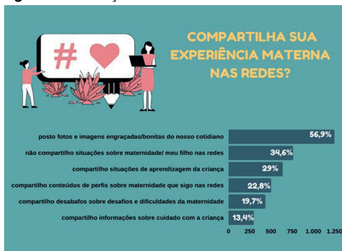
Figura 2 – Publicações sobre maternidade nas redes

Em um primeiro momento do instrumento, procuramos compreender se as mães publicavam posts sobre maternidade ou sobre seus filhos nas redes sociais. Segundo pode ser visto na Figura 2, a maior parte das mães (56,9%) afirmou que publica imagens e situações engraçadas ou bonitas do seu cotidiano, seguido de 29%, que fazem postagens sobre situações de aprendizagem de seus filhos – que, na perspectiva do desenvolvimento infantil, também podem ser consideradas como momentos positivos.