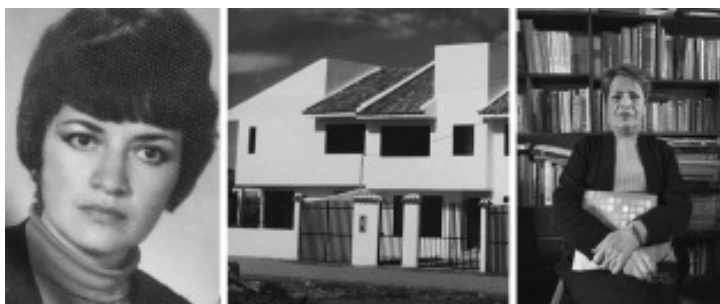
Imagen 3: Ibarra, años de juventud y actualidad/ Viviendas Calle Lope de Vega.

Nacida en Quito, viaja a Cuenca en su adolescencia. Allí decide estudiar arquitectura, titulándose en 1970 en la UCUENCA, convirtiéndose en la primera mujer ecuatoriana titulada en arquitectura en el país, junto a sus colegas guayaquileñas. Inmediatamente concursa por una plaza en docencia en la misma universidad, obteniendo la calificación más alta. Dictó las materias de Taller, Dibujo Técnico y Materiales de Construcción.