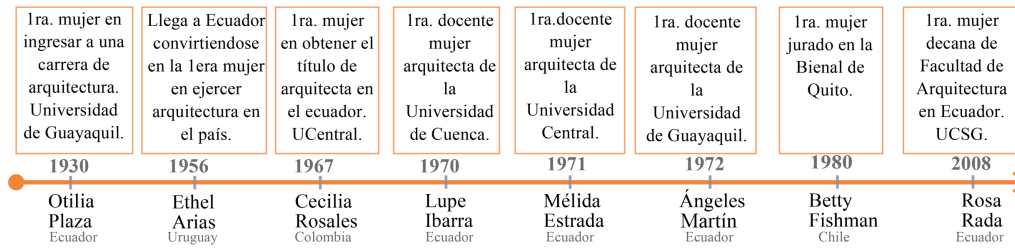
Gráfico 1: Eventos relevantes.