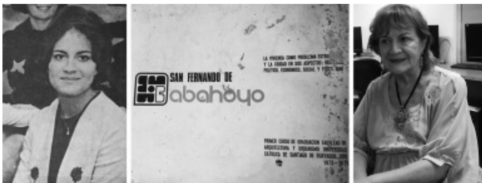
Imagen 6: Solano, años de juventud y actualidad, y portada de su trabajo de titulación.

guayaquileñas en estudiar un postgrado, situación que provocó rechazo por parte de los miembros de su universidad.