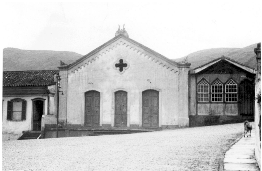
Figura 1 - Fachada após retirada das luminárias e restauração das portas nos anos de 1958 e 1959.

No decorrer de 1993, a Casa da Ópera teve reformada sua estrutura de cama-