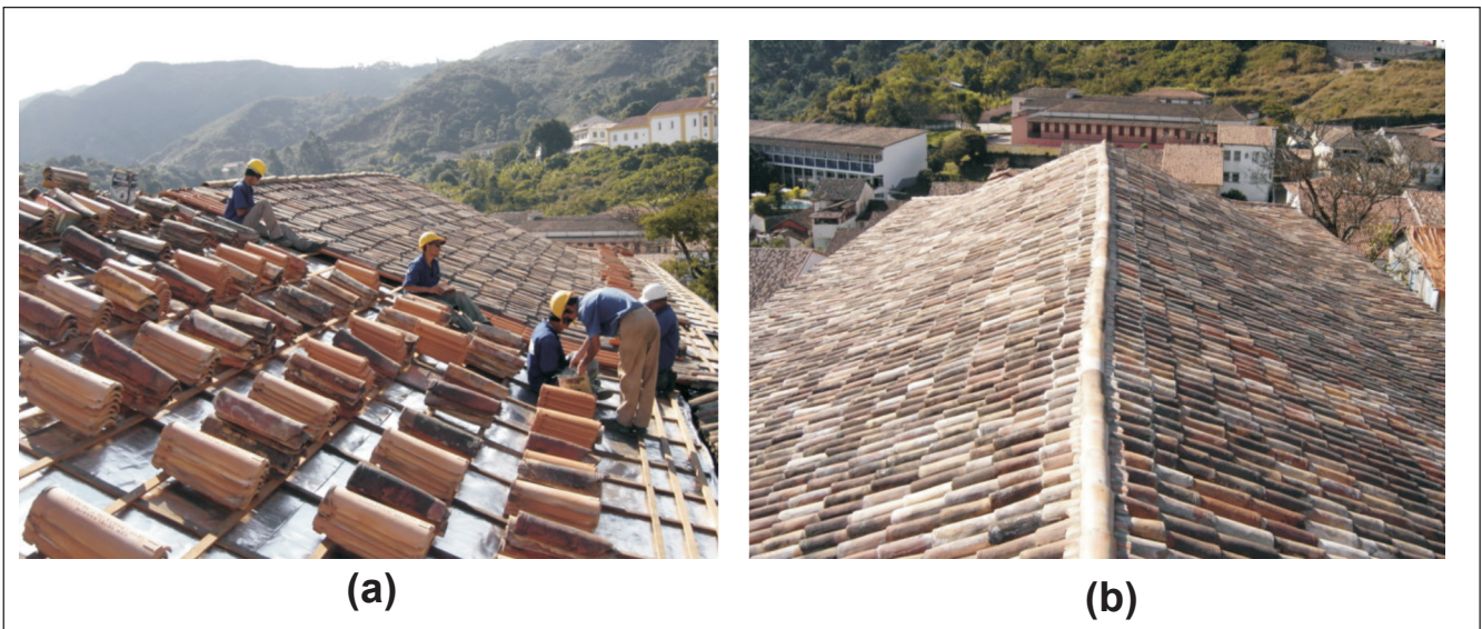
Figura 5 - Restauração do telhado: (a) colocação de manta aluminizada; (b) colocação das telhas.