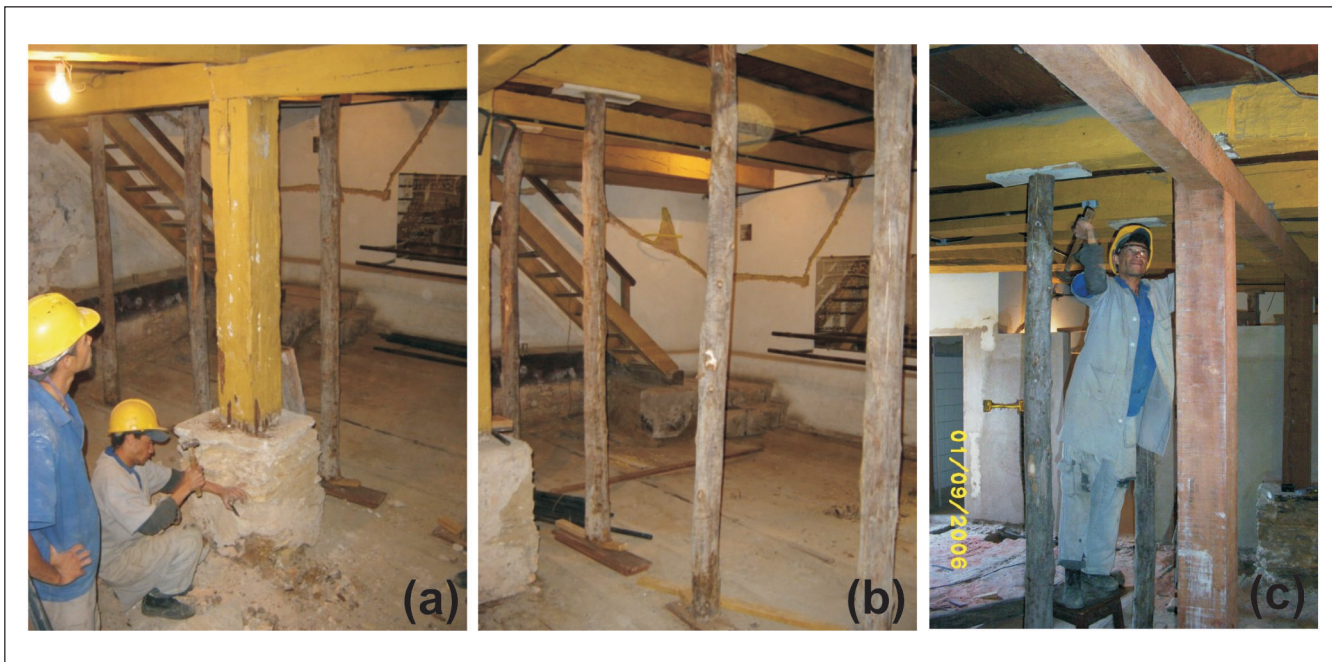
Figura 6 - Remoção da sapata central com auxílio de escoramentos e colocação de pilar e de viga de madeira maciça.

Na recuperação e/ou restauração de edificações antigas, de importância histórica, deve-se fazer um planejamento detalhado para que o processo de intervenção não venha a comprometer a edificação original. Na intervenção realizada, foram observadas as diretrizes do Comitê Internacional para Análise e Restauração de Imóveis do Patrimônio Arquitetônico como referências básicas e adequadas em intervenções históricas.