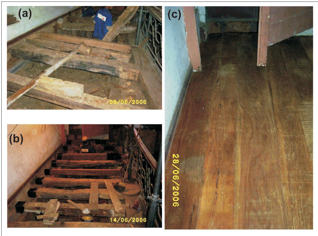
Figura 7 - Restauração do piso.