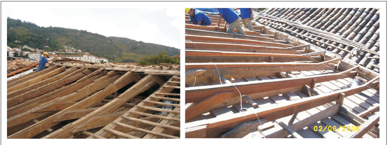
Figura 4 - Remoção de peças deterioradas do telhado.