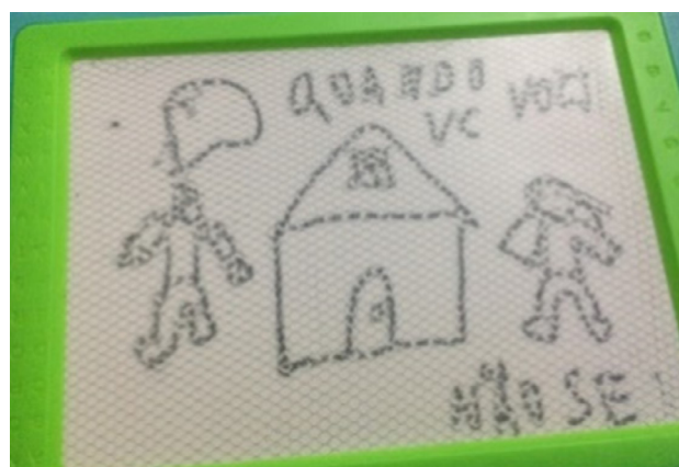
Figura 2 - Desenho elaborado por Segredo, 9 anos. Campinas, São Paulo, Brasil, 2020

O irmão ilustrou, conforme Figura 2, o momento em que a mãe sai da residência da família para ir ao hospital com a criança com doença crônica. Questiona sobre sua dúvida de quando a mãe retornará para casa, e a mãe responde que não tem previsão. Revelou que conviver com uma criança com doença crônica altera sua vida, pois há rupturas nas relações familiares, sendo que a mudança mais evidente é quando há, de fato, a necessidade da hospitalização. Sendo assim, a ida do familiar com a criança para o hospital gera medo, sofrimento, dor e preocupações, em relação a si mesmo, à criança com doença crônica e com a mãe.