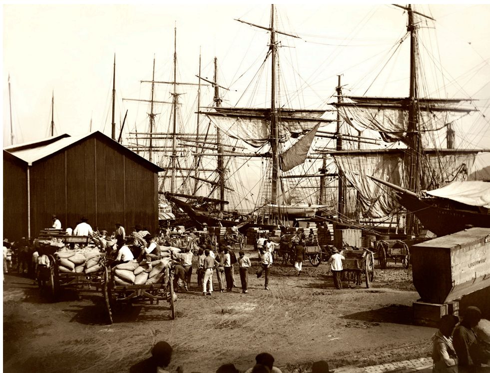
Figura 1 Porto do Valongo

Fonte: Marc Ferrez, déc. 1880. Acervo Instituto Moreira Salles.