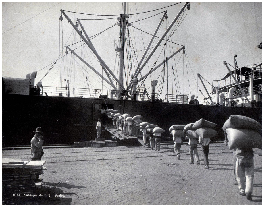
Figura 2 Porto de Santos após a construção do cais de pedra pela Cia. Docas de Santos, década de 1900