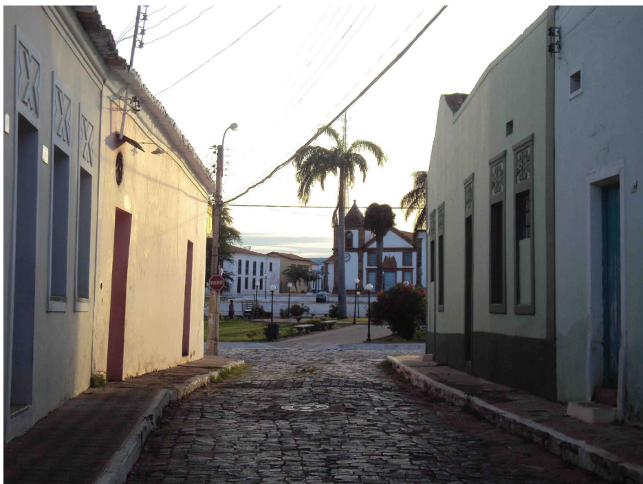
Figura 05: Cidade de Oeiras do Piauí. 2010.