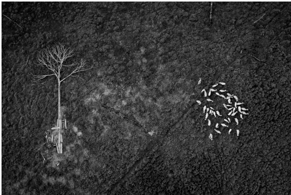
Invasão de território 8