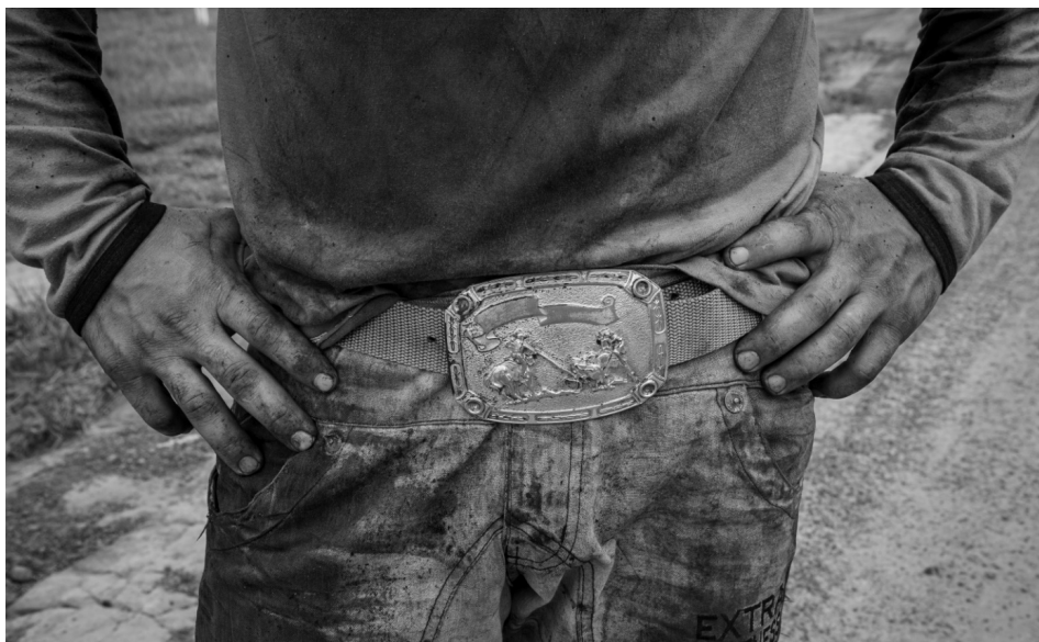
Cinturão da força 9