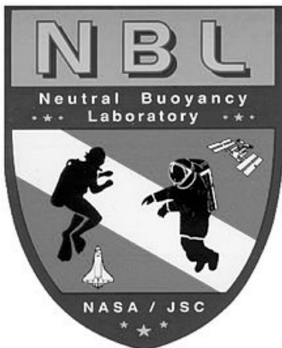
Figura 3 – Logotipo do Laboratório de Flutuação Neutra (Neutral Buoyancy Laboratory, Nasa Johnson Space Centre).

Tal como as conquistas do mergulho autônomo em se apropriar dos mares por meio do controle da flutuação, a suspensão é também um tropo significativo para entender ambientes extremos, particularmente o espaço sideral. Contudo, essa imagem de suspensão frequentemente parece subsumida por tropos que se referem ao movimento ao longo da superfície terrena. Do ponto de vista da astronáutica, a coexistência dos tropos de superfície e de suspensão é bem capturada no modo como os astronautas se referem à experiência de vestir um traje do lado de fora de uma espaçonave. Astronautas chamam esse ato de “caminhada espacial [ spacewalk ]”, conduzida por eles de dentro de trajes projetados para andar em superfícies sólidas (ao invés de navegar dentro de um meio), ainda que frequentemente enquanto em suspensão total com um cabo de segurança preso à nave. Desse modo, muitas das assim chamadas “caminhadas espaciais”, incluindo a famosa conduzida pelo tenente Edward White em 1965 (creditado como o primeiro norte-americano a andar no espaço), dificilmente se parecem com andar. Retornando ao treinamento subaquático dos astronautas da Nasa, esse contraste entre andar e flutuar enquanto suspensos no meio é também visível no logo da NBL, que exibe um mergulhador autônomo próximo a um astronauta em um traje espacial, ambos em suspensão (Figura 3).