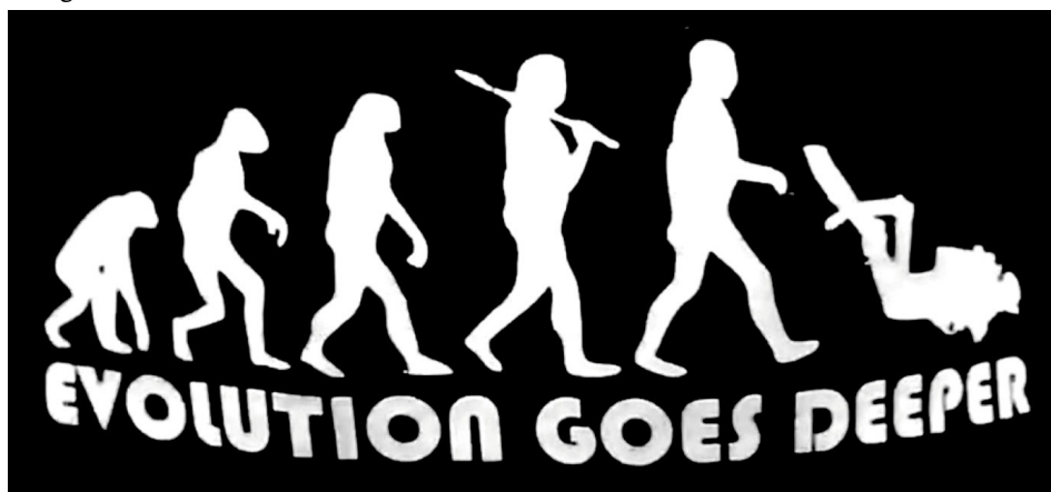
Figura 2 – Evolução indo mais fundo.

Ideias similares são comuns nos mergulhos livres, nos quais o objetivo final é ir tão fundo quanto possível com uma única respiração. Desde 1980, particularmente depois de recordes mundiais pioneiros, como os de Enzo Maiorca, mergulhadores constantemente empurraram os limites do mergulho livre. Como resultado desses esforços, fisiologistas foram forçados a descer o limite da resistência humana à