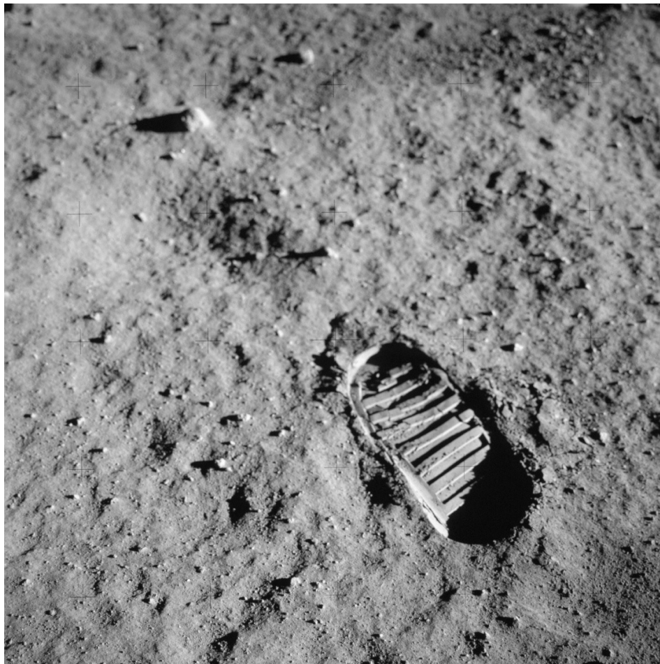
Figura 6 – Passo inaugural de Neil Armstrong.

Contudo, se a compreensão da vida extrema não é um mero esforço conceitual, mas de algum modo envolve um ato de suspensão, como Valentine, Olsen e Battaglia propõem, então o desafio não é simplesmente expandir nossa mirada limitada ao andar um pouco mais, na expectativa de que nossos horizontes recuarão ainda mais 38 . Radicalmente, o desafio implica em saltar dentro do vazio, deixar-nos ir! Talvez um dia astronautas e astrobiólogos possam seguir mergulhadores em sua transição do pisar sólido para a suspensão fluida, espelhando sua metamorfose de humanos para focas ou peixes, uma imagem comum usada por mergulhadores profissionais