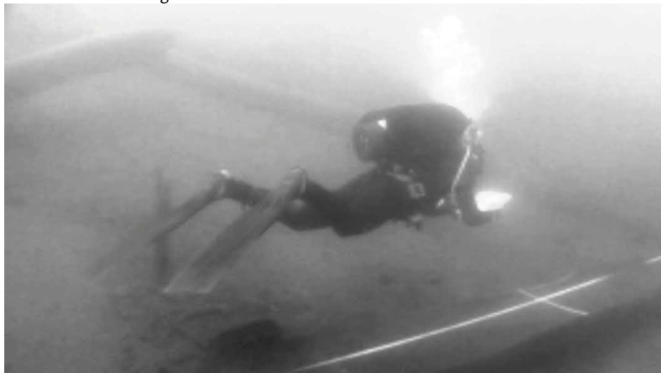
Figura 1 – Arqueólogo mergulhador submerso faz um desenho técnico.

A suspensão é crucial para o mergulho científico porque ela previne que os mergulhadores científicos pisem em coisas valiosas que eles desejam inspecionar enquanto são empurrados pelas correntes subaquáticas. Para os arqueólogos e biólogos com quem trabalho, a suspensão permite que eles naveguem por cima, respectivamente, da cultura material e da vida, sem perturbá-las. Isso permite que