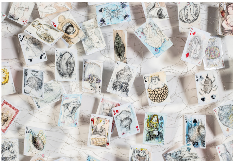
Figura 2 – Ivana Paim, “Sorte”, da série “Tramas de baralhos” (detalhe), 2022, desenho e aquarela sobre cartas de baralho entrelaçadas por fios de metal, 70 x 273 cm.