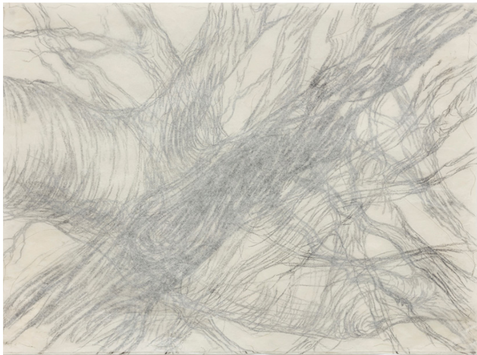
Figura 5 – Ivana Paim, desenho da série “Reminiscências”, 2023, carvão, verniz e fio de metal sobre papel de arroz, 47 x 64 cm.