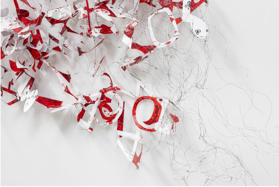
Figura 4 - Ivana Paim, “Destinos”, da série “Tramas de baralhos” (detalhe), 2022, desenho: acrílica e látex sobre cartas de baralho recortadas e entrelaçadas por fios de metal, 112 x 120 cm.