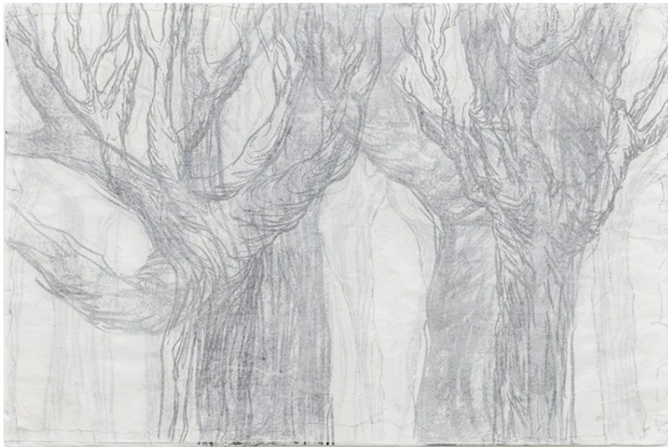
Figura 6 – Ivana Paim, desenho da série “Reminiscências”, 2023, carvão, verniz e fio de metal sobre papel de arroz, 47 x 69 cm.