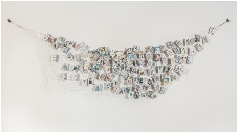
Figura 1 – Ivana Paim, “Sorte”, da série “Tramas de baralhos”, 2022, desenho e aquarela sobre cartas de baralho entrelaçadas por fios de metal, 70 x 273 cm.