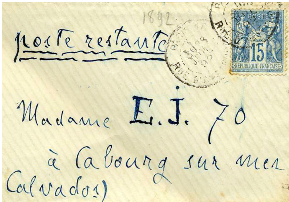
Figura 1 – © Centro Zola, Item, CNRS

poste restante Madame E. J. 70 à Cabourg sur mer (Calvados)