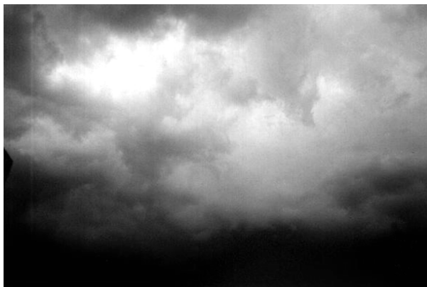
Figura 2 - En la calle, el cielo como libertad

Las respuestas en nuestra investigación dejan clara la concepción de la persona y su relación con las fuerzas del cambio social y económico, como protagonista y como sujeto conciente de que nada TUVO, y con la percepción sobre la intervención judicial en la familia como ineficaz y que quiere, necesita, o se mueve "EN LA CALLE", que también tiene el cielo como libertad, o el distanciamiento del Estado como una institución de protección y acogimiento para sus necesidades, como podemos observar en las Figuras 2 y 3.