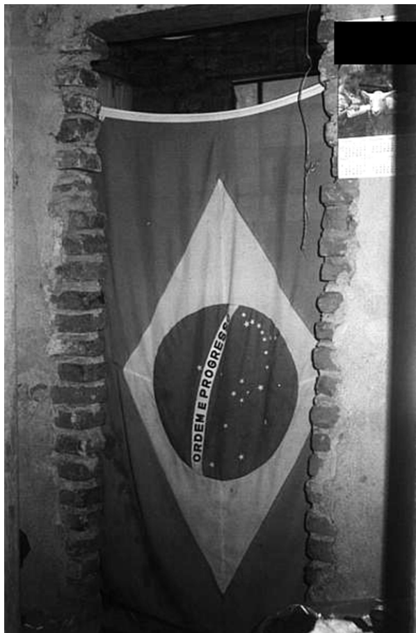
Figura 3 - Puerta del baño de la casa cubierta por el símbolo de la Patria

La perspectiva ecológica utilizada en el presente estudio se constituyó en un abordaje teórico que nos auxilió, a comprender la amplitud y complejidad del universo estudiado y a describir y explicar los efectos del ecosistema en cada persona que compone la familia (6) .