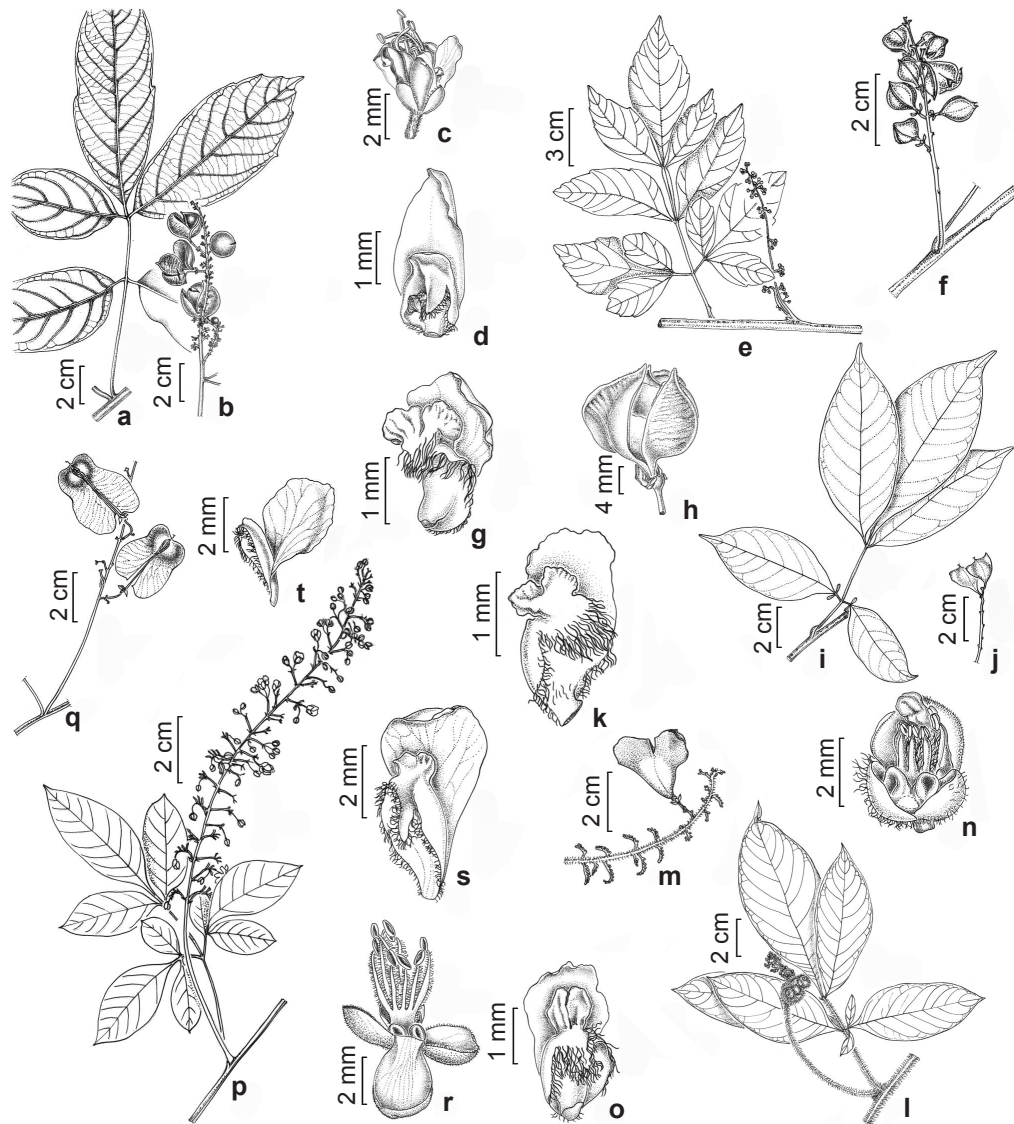
Figura 3 – a-d. Paullinia ferruginea – a. ramo vegetativo; b. ramo com cápsulas maduras; c. flor estaminada; d. face adaxial da pétala posterior, evidenciando apêndice petalífero. e-h. Paullinia micrantha – e. ramo com flores; f. ramo com frutos; g. face adaxial da pétala posterior, evidenciando apêndice petalífero; h. cápsula madura expondo parcialmente uma semente arilada. i-k. Paullinia racemosa – i. ramo vegetativo; j. ramo com frutos imaturos; k. face adaxial da pétala posterior, evidenciando apêndice petalífero. l-o. Paullinia revoluta – l. ramo com flores; m. ramo com cápsula madura; n. flor pistilada desprovida da sépala posterior e da corola, evidenciando os lobos nectaríferos; o. face adaxial da pétala posterior, evidenciando apêndice petalífero. p-t. Serjania salzmanniana – p. ramo com flores; q. ramo com frutos; r. flor estaminada desprovida da corola, evidenciando lobos nectaríferos; s. face adaxial da pétala posterior, evidenciando apêndice petalífero; t. face adaxial da pétala anterior evidenciando apêndice petalífero. (a-d Paixão 51; e, g Sylvestre 997; f, h Fernandes 779; i-j Perdiz 421; k Santos 288; l, n-o Perdiz 564; m Perdiz 487; p, r-t Carvalho 7006; q Cardoso 1636). Figure 3 – a-d. Paullinia ferruginea – a. sterile branch; b. branch with mature capsules; c. staminate flowers; d. adaxial view of posterior petal showing adnate appendage. e-h. Paullinia micrantha – e. branch with flowers; f. branch with fruits; g. adaxial view of posterior petal, showing adnate appendage; h. mature capsule, partially exposing an arillate seed. i-k. Paullinia racemosa – i. sterile branch; j. branch with fruits showing immature capsules; k. adaxial view of posterior petal showing adnate appendage. l-o. Paullinia revoluta – l. branch with flowers; m. branch with mature capsule; n. pistillate flower devoid of posterior sepal and corolla, showing nectary lobes; o. adaxial view of posterior petal, showing adnate appendage. p-t. Serjania salzmanniana – p. branch with flowers; q. branch with fruits; r. staminate flower devoid of corolla, showing nectary lobes; s. adaxial view of posterior petal showing adnate appendage; t. adaxial view of anterior petal, showing adnate appendage. (a-d Paixão 51; e, g Sylvestre 997; f, h Fernandes 779; i-j Perdiz 421; k Santos 288; l, n-o Perdiz 564; m Perdiz 487; p, r-t Carvalho 7006; q Cardoso 1636).