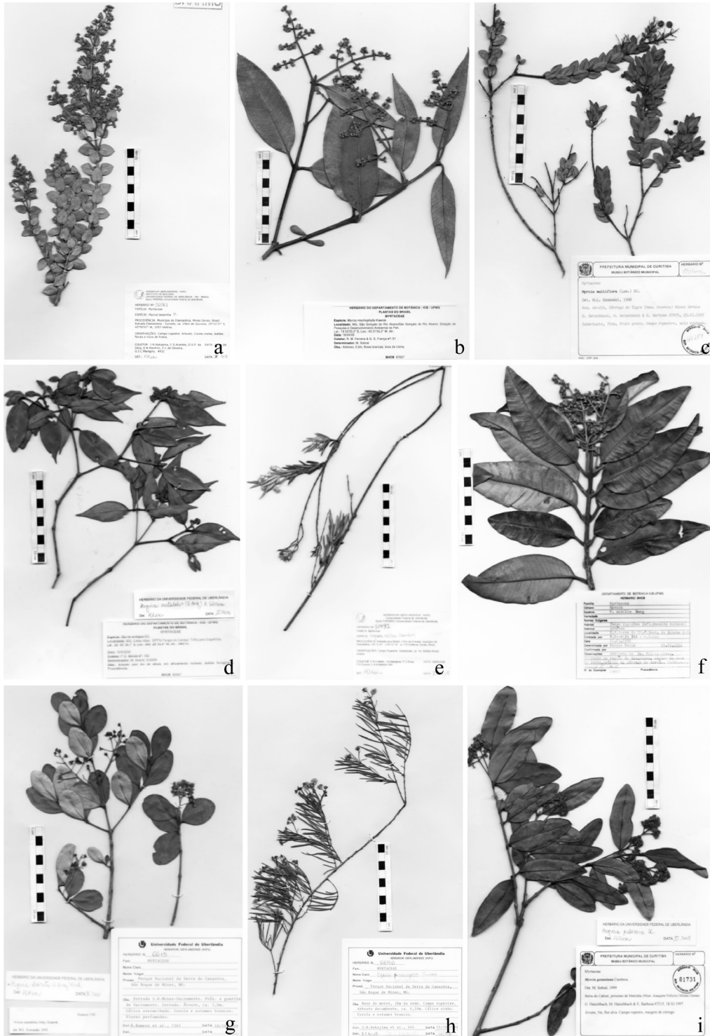
Figura 2 – a. Myrcia lasiantha DC.; b. M. mishophylla Kiaersk.; c. M. multiflora (Lam.) DC.; d. M. mutabilis (O. Berg) N. Silveira; e. M. nivea Cambess.; f. M. nobilis O. Berg; g. M. obovata (O. Berg) Nied.; h. M. pinifolia Cambess.; i. M. pubescens DC.