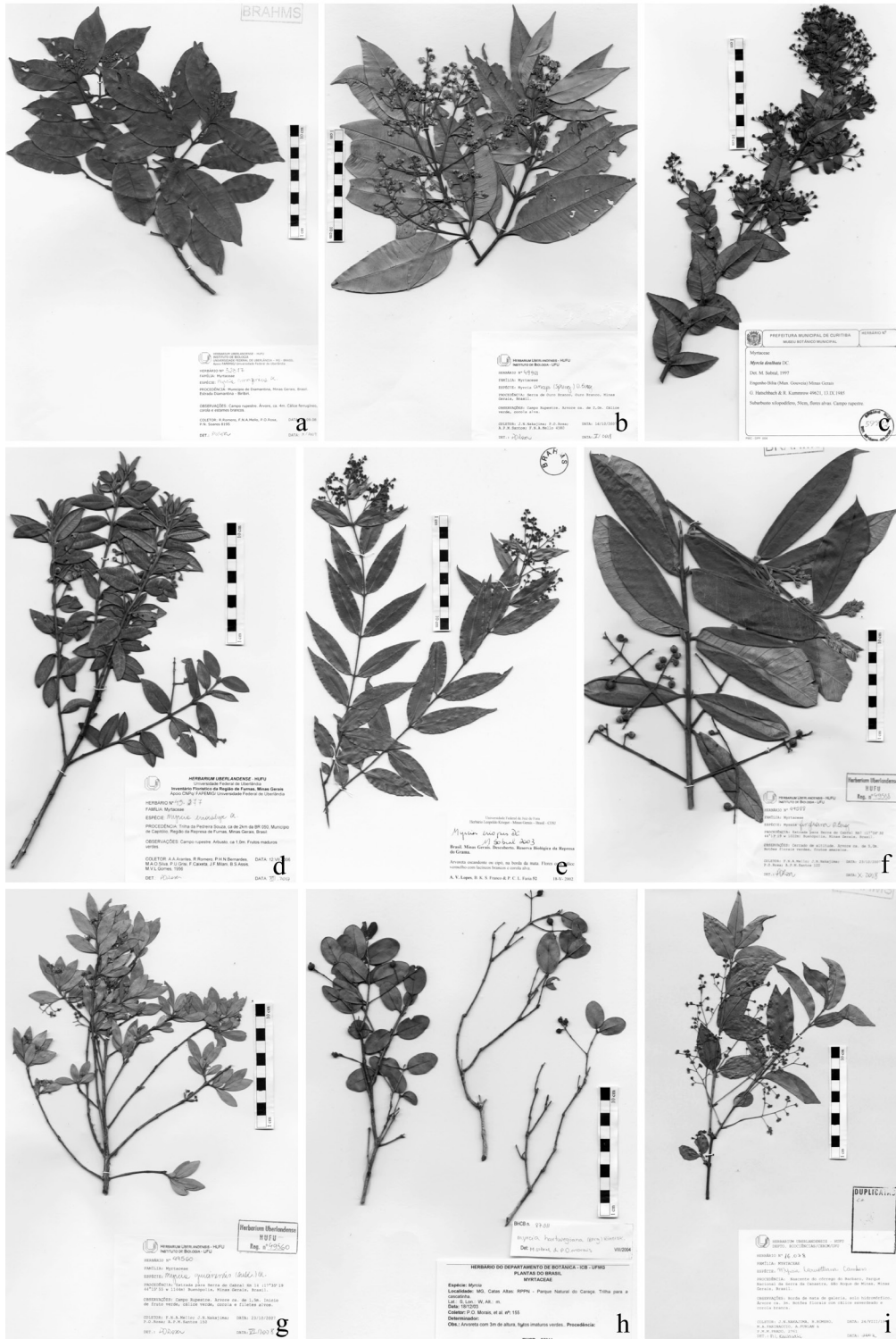
Figura 1 – a. Myrcia amazonica DC.; b. M. anceps (Spreng.) O. Berg.; c. M. dealbata DC.; d. M. ericalyx DC.; e. M. eriopus DC.; f. M. fenzliana O. Berg.; g. M. guianensis (Aubl.) DC.; h. M. hartwegiana (O. Berg) Kiaersk.; i. M. laruotteana Cambess.