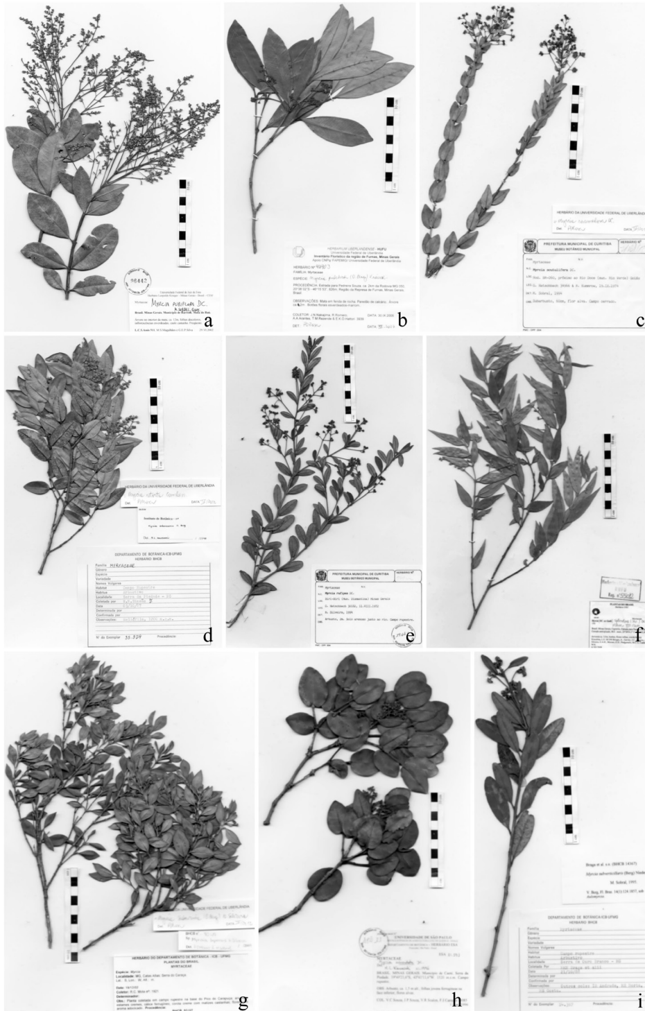
Figura 3 – a. Myrcia pubiflora DC.; b. M. pulchra (O. Berg) Kiaersk.; c. M. racemulosa DC.; d. M. retorta Cambess.; e. M. rufipes DC.; f. M. splendens (Sw.) DC.; g. M. subavenia (O. Berg) N. Silveira; h. M. subcordata DC.; i. M. subverticillaris (O. Berg) Kiaersk.

Figure 3 – a. Myrcia pubiflora DC.; b. M. pulchra (O. Berg) Kiaersk.; c. M. racemulosa DC.; d. M. retorta Cambess.; e. M. rufipes DC.; f. M. splendens (Sw.) DC.; g. M. subavenia (O. Berg) N. Silveira; h. M. subcordata DC.; i. M. subverticillaris (O. Berg) Kiaersk.