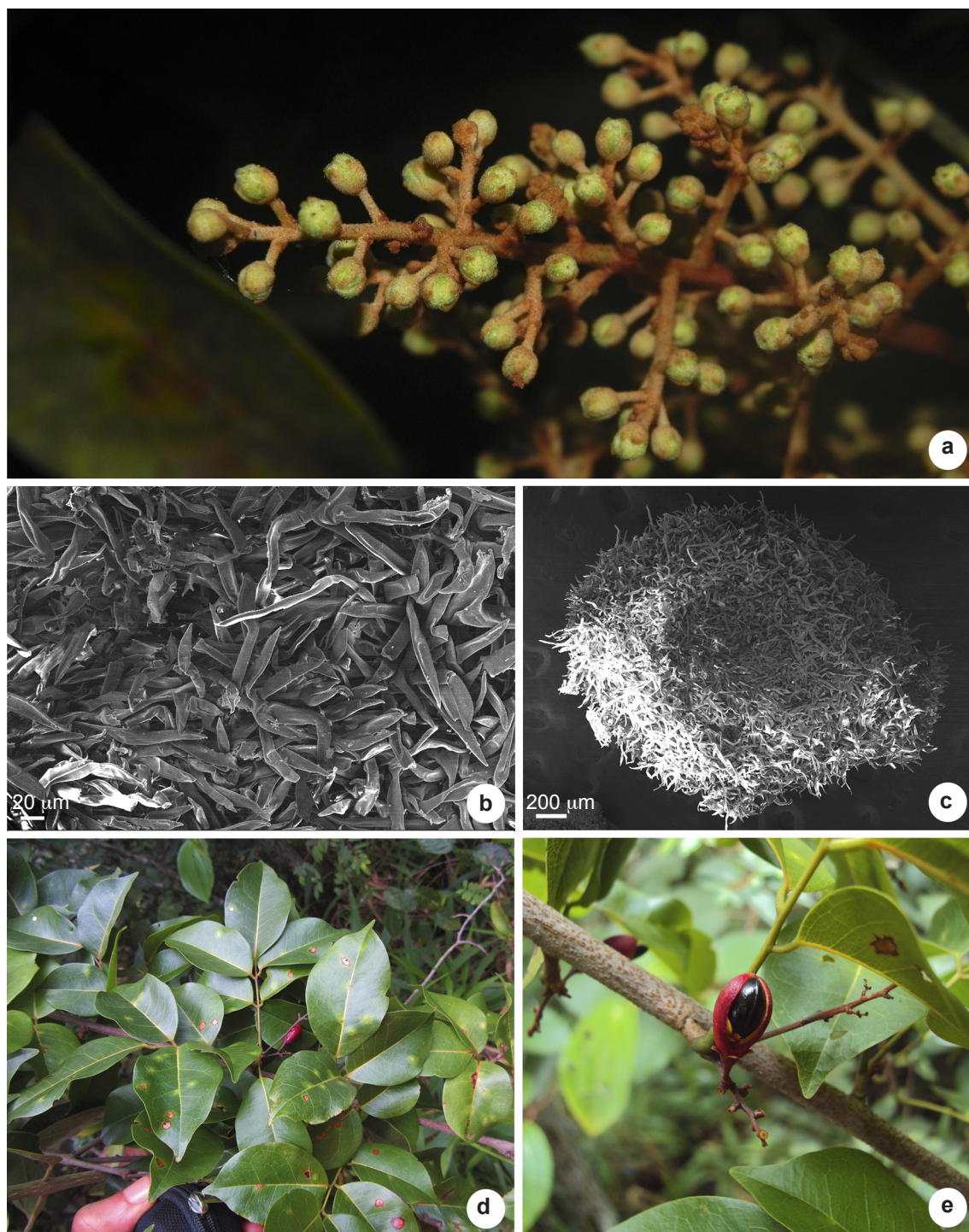
Figura 2 – a-c. Connarus perrottetii – a. inflorescência com botões; b. indumento na face abaxial da folha (em MEV); c. indumento do botão (em MEV). d-e. Rourea doniana – d. hábito; e. ramo com folículo maduro.