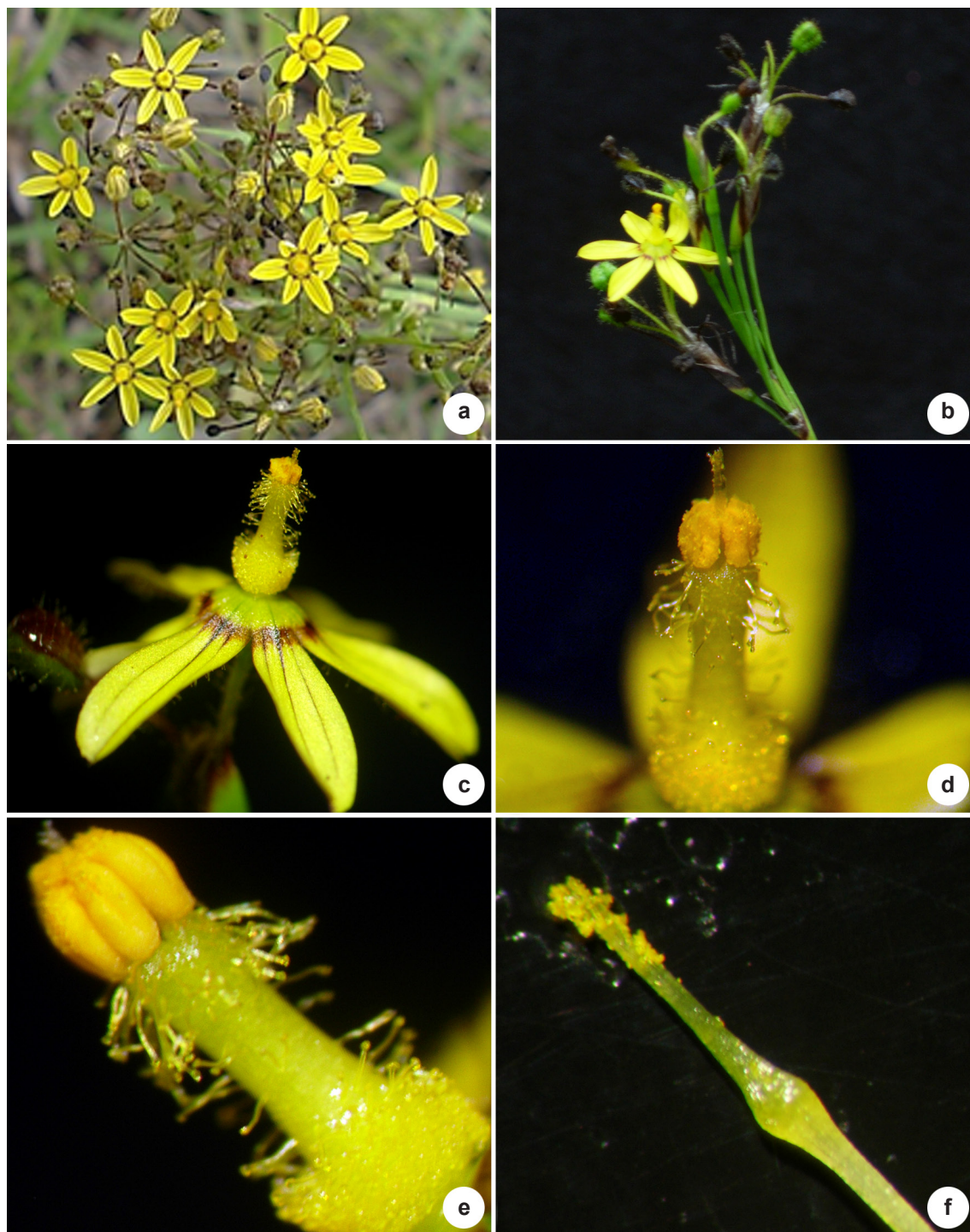
Figura 1 – Detalhes da estrutura reprodutiva de S. commutatum . a-b, detalhes da inflorescência. c-d, tricomas glandulares em dois níveis distintos. e, anteras fusionadas. f, êmbolo na porção mediana do estilete.