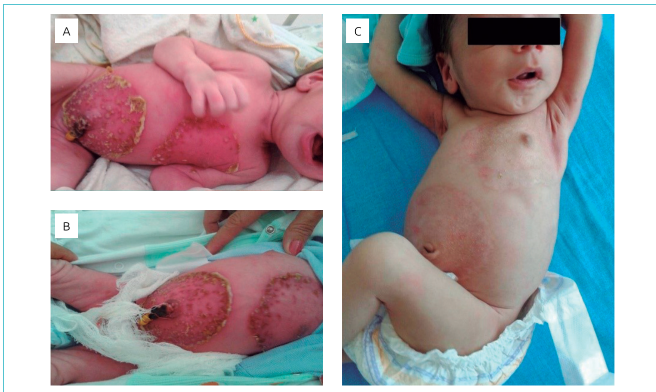
Figura 2 Processo de remissão progressiva das lesões características do pênfigo vulgar no neonato. (A, B e C) imagens fotográficas mostrando melhora das lesões vesicobolhosas extensas em região anterior do tórax e do abdome do neonato.