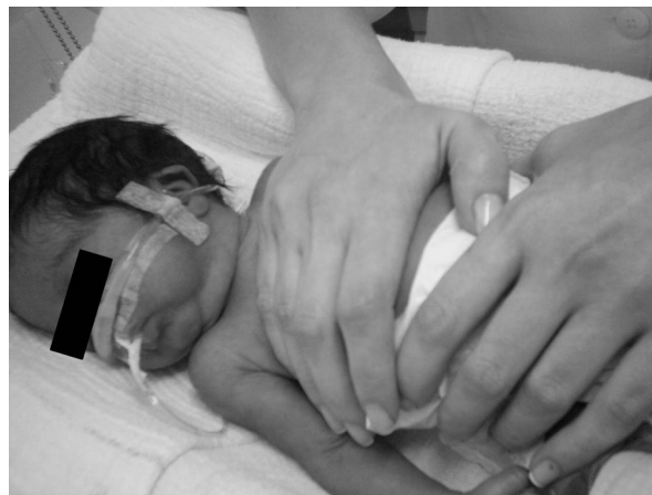
Figura 1 Técnica de fisioterapia respiratória do aumento do fluxo expiratório em recém-nascidos prematuros.

Para investigar se a fisioterapia respiratória promoveu alteração do FSC, usou-se análise de variância para medidas repetidas com as variáveis respostas transformadas em postos ( ranks ). Cada criança serviu como seu próprio controle. A variável gemelaridade foi usada para ajuste nos modelos, a fim de se evitar viés estatístico, uma vez que os RN gemelares não têm antecedentes obstétricos independentes. O nível de significância estatística adotado foi p < 0,05 .