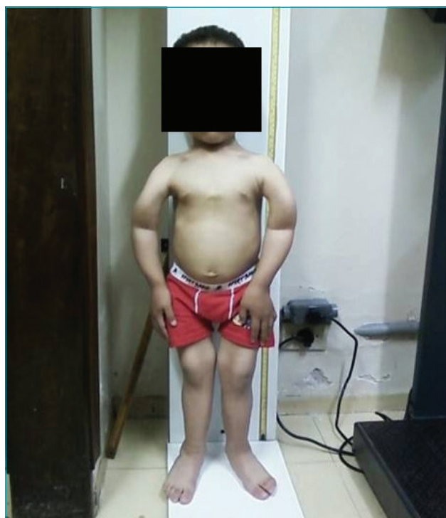
Figura 2 Aspectos clínicos do paciente relatado após início da deambulação.