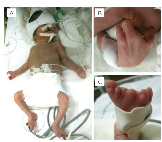
Figura 2 Características clínicas do paciente. Observe especialmente a fenda labial (A) e a ectrodactilia de mãos (A e B) e pés (A e C).

O paciente apresentou pneumotórax e parada cardior-respiratória na primeira semana de vida, falecendo com 1 mês e 26 dias.