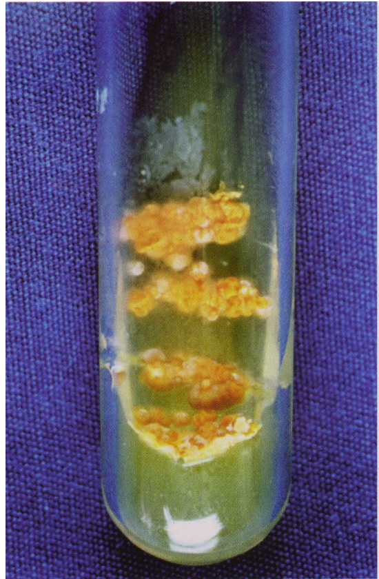
Figura 2 - Colônias de Nocardia sp em secreção do abscesso peribulbar.

A medicação foi mudada para sulfametoxazol-trimetropim em altas doses, mantida por 10