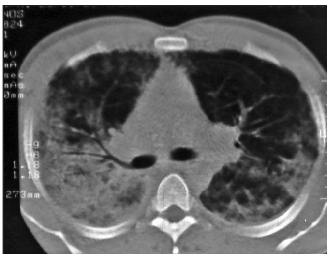
FIGURA 2 - Tomografia de tórax com opacidade mista interstício-alveolar difusa bilateral, mais acentuada à direita.