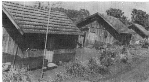
Fig. 3 — Localização das habitações existentes no sítio.