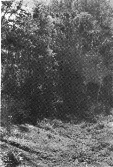
Fig. 1 — Reserva florestal que margeia o rio.

(Leal et al. 2 , 1961; Forattini 1 et al., 1970 e Pessoa & Vianna 4 , 1974). No Estado do Paraná, além de Curitiba, já foi assinalado em cinco localidades (Lima 3 et al., 1964). Em Cambé é a primeira vez que este fato é observado.