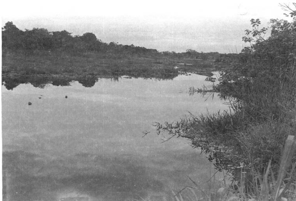
Figura 1 . Aspecto do rio Peropava, Iguape, Estado de São Paulo, notando-se a cobertura da superfície por vegetação aquática, com abundância de representantes de Pistia .

b) em campo aberto de cultivo e uma armadilha (CDC-2), distante cerca de 100m da casa, em linha reta;