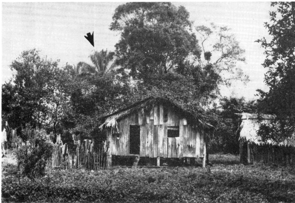
Fig. 2 — Casa de residência do caso EP, no Bairro Taquari da Fazenda Santa Maria, município de Cananéia, Estado de São Paulo. Note-se o estado precário de conservação, a proximidade da vegetação, destacando-se um exemplar de palmeira Attalea assinalado pela flexa, onde se localizou foco natural de Trypanosoma tipo cruzi .

Em 14 habitantes do Bairro foi realizada a prova de imunofluorescência revelando-se em todos completamente negativa. Da mesma forma, idêntico resultado foi obtido com os xenodiagnósticos levados a efeito em seis cães ali encontrados.