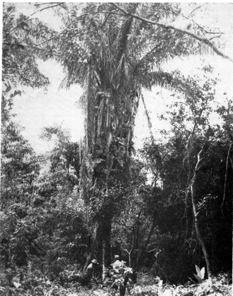
Fig. 3 — Exemplar de Attalea , assinalado na figura anterior, em cuja copa foram coletados espécimens de Triatoma tibiamaculata naturalmente infectados por Trypanosoma tipo cruzi .