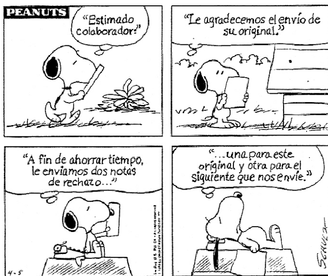
Figura 1 - Um autor latino-americano perante um editor internacional?

No Congresso Internacional de Epidemiologia de 2002, em Montreal, houve uma mesa redonda sobre esse tema, que reuniu alguns editores de revistas internacionais. Na ocasião, o primeiro autor do presente artigo apresentou uma análise de revisão dos artigos publicados no International Journal of Epidemiology (IJE) e no American Journal of Epidemiology (AJE) em 2000 e 2001. No primeiro, 11% dos primeiros autores de artigos eram de países do Sul; no segundo, 6%. Estes resultados foram comparados com o percentual de membros dos conselhos editoriais dessas revistas que, naquela época, trabalhavam em países do Sul: nenhum dos 65 editores associados do AJE, e dois em 16 no IJE. Na revista Epidemiology , nenhum dos 30 conselheiros era do Sul. A situação era discretamente melhor no American Journal of Public