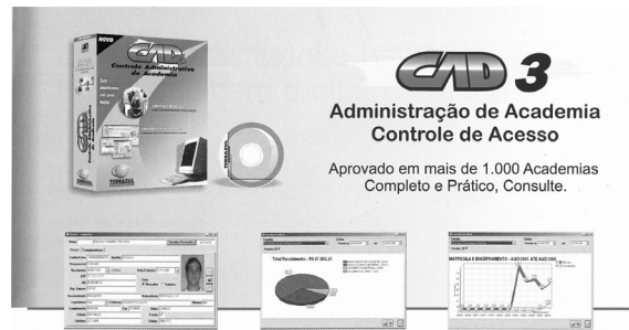
Figura 2 - Informação sobre “pirataria” dos produtos Terrazul, em vermelho

exibida uma nota em vermelho, que chama a atenção para uma decisão judicial contra uma concorrente que copiou e comercializou ilegalmente um dos seus produtos (Figura 2), tornando explícita a presença das competições econômicas características do mundo globalizado, que significativamente aponta para agenciamento tecnológico em prol de espaços de vitalidade e beleza simbolizados na academia de ginástica. Locus para os corpos e aparelhagens que os moldam, condicionam e até os produzem, a academia torna-se uma espécie de templo no qual as tecnologias modernas, tão difundidas e decantadas na Expo Wellness Rio , são aplicadas para atender à demanda de uma sociedade de livre mercado e reverberam em seus seguidores toda uma cultura de embelezamento, vigor, ampliação infinita de potencialidade e funcionalidade de seus corpos, que traduzem concepções espaço/temporais próprias do que é ter boa aparência.