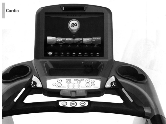
Figura 1 - Painel do aparelho Matrix

exibida uma nota em vermelho, que chama a atenção para uma decisão judicial contra uma concorrente que copiou e comercializou ilegalmente um dos seus produtos (Figura 2), tornando explícita a presença das competições econômicas características do mundo globalizado, que significativamente aponta para agenciamento tecnológico em prol de espaços de vitalidade e beleza simbolizados na academia de ginástica. Locus para os corpos e aparelhagens que os moldam, condicionam e até os produzem, a academia torna-se uma espécie de templo no qual as tecnologias modernas, tão difundidas e decantadas na Expo Wellness Rio , são aplicadas para atender à demanda de uma sociedade de livre mercado e reverberam em seus seguidores toda uma cultura de embelezamento, vigor, ampliação infinita de potencialidade e funcionalidade de seus corpos, que traduzem concepções espaço/temporais próprias do que é ter boa aparência.