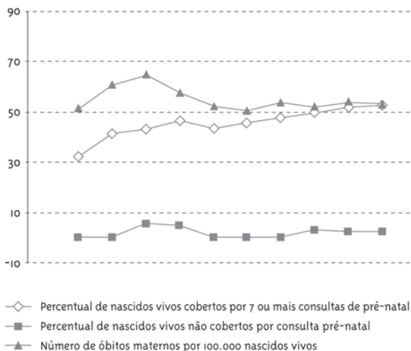
Gráfico 1 - Indicadores de mortalidade materna e cobertura pré-natal, Brasil, 1996-2005.