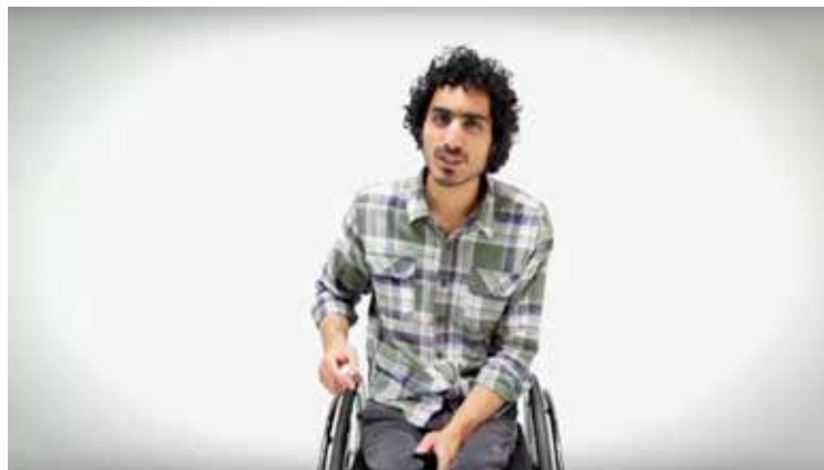
Figura 5. El presentador del video “lesión medular y sexualidad.”

Estos discursos intentan transmitir experiencias sexuales que se escapan a las prácticas de la sexualidad falocéntricas, apelando a cierto acercamiento entre la experiencia de la persona con discapacidad y las demás. El sentido que parece sobrevolar estos discursos es el de normalización de la sexualidad “extraña”, a través de representaciones que cargan con una retórica realista. La misma, según Garland-Thomson, reduce la “distancia” entre el observado y el observador, “regularizando la figura discapacitada para evitar la diferenciación y despertar la identificación frecuentemente normalizando y por momentos minimizando la marca visual de la discapacidad” (Garland-Thomson, 2002b:199. La traducción nos pertenece). En este sentido, es sugerente la imagen del presentador del video y la foto que acompaña el artículo de Andrea de María. En el video, como ya dijimos, la vestimenta y la actitud del presentador lo muestran como a un joven más, desinhibido, pero sin llegar a lo maravilloso (fig. 5). En el segundo caso, un joven en silla de ruedas vestido con campera de cuero y jean, es acompañado por una joven mujer que parece ser su pareja. La joven impulsa su silla cruzando una calle mientras lo mira sonriendo (fig. 6).