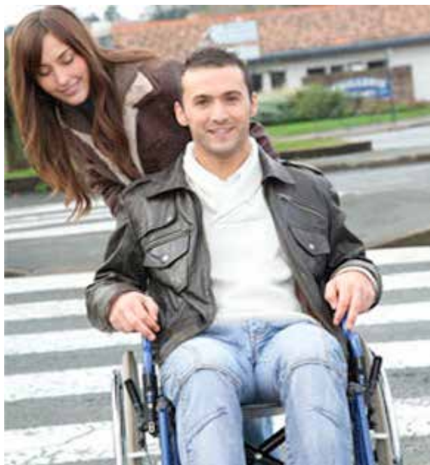
Figura 6. La imagen que acompaña la nota de Andrea de Maria parece utilizar una retórica realista.

Estos discursos no cuestionan los mecanismos heteronormativos que rigen la sociedad, sino más bien son ejemplo de la flexibilidad del sistema de normalidad funcional que, al igual que sucede con el sistema heterosexual, intenta transformar la excepción en un nicho de mercado. Un ejemplo se ve en la sugerencia de consumo de Viagra, importante medicamento de lo que Paul B. Preciado ha llamado “capitalismo farmacopornográfico”. Según Preciado, este sistema habría emergido de las ruinas de la Segunda Guerra Mundial mediante el reinado de los fármacos, la sexología, la endocrinología y las imágenes pornográficas multimedia. Según la autora, “El éxito de la tecnociencia contemporánea es transformar nuestra depresión en Prozac, nuestra masculinidad en testosterona, nuestra erección en Viagra...” (Preciado, 2002:33) En esta sociedad, el cuerpo es disciplinado, ya no mediante un biopoder ortopédico (como las instituciones, los discursos jurídicos y científicos) de administración, clasificación y disciplinamiento, sino que “las tecnologías entran a formar parte del cuerpo, se diluyen en él, se convierten en cuerpo.” (2002:66). De aquí que la imagen del varón con discapacidad, en la retórica realista, parezca transformarlo en un ciudadano más.