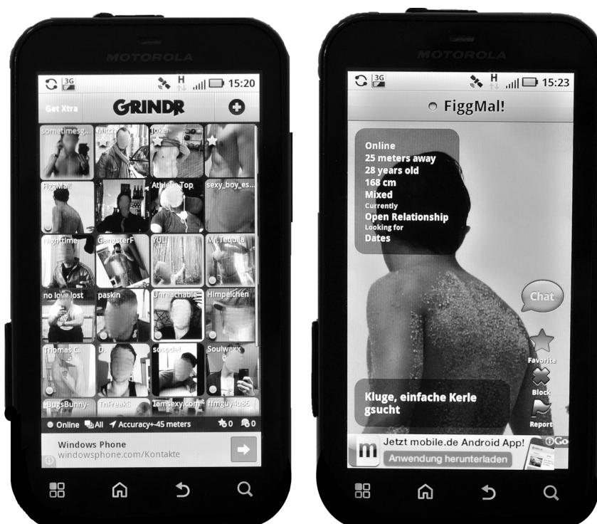
Lámina 6. Vista general de la aplicación Grindr desde mi teléfono celular, y del perfil de un usuario localizado en algún punto a 25 metros a la redonda. Nótese en la vista general la información provista en la barra negra inferior sobre el margen de error de las localizaciones reportadas (+/- 45 metros, aunque ocasionalmente puede ser menor), y las estrellas con las que el dueño del teléfono (cuyo perfil aparece en la esquina superior izquierda) puede marcar a otros como "favoritos". Obsérvese en la vista del perfil la información referente a la distancia aproximada a la que se encuentra la persona a la que pertenece, y el repertorio de acciones que ofrece la aplicación. Los rostros de usuarios presentados en la vista general fueron difuminados por mí.

Scruff o GuySpy , que permiten ubicar potenciales compañeros eróticos en radios geográficos más reducidos y precisos gracias a la articulación de la comunicación mediada por internet y el empleo de sistemas de posicionamiento global GPS (véase la lámina 6). De acuerdo a mis observaciones, los espacios de socialización introducidos por ese desarrollo tecnológico cuyo uso se sustenta en buena medida en la popularización de los smartphones , las tabletas y las conexiones a internet mediante la red celular, tienden a debilitar la preeminencia del histeriqueo.