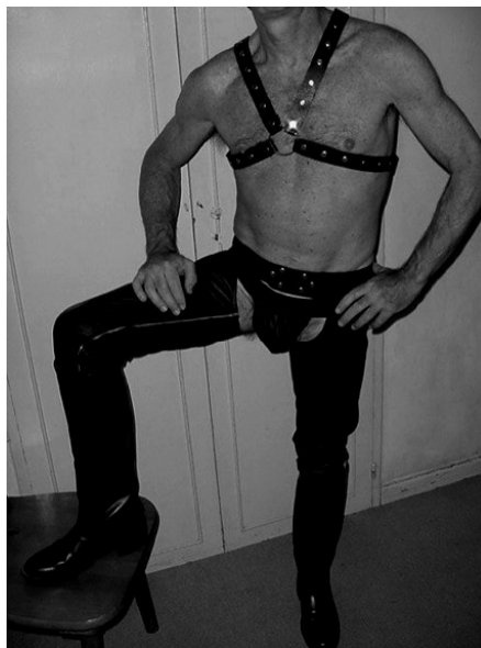
Lámina 3. Fotografía publicada en un perfil de Planetromeo.com. Su autor eligió un nombre similar a hotpasvisit .

las habilidades para producir y leer ese tipo de textos visuales son aprehendidas a medio camino entre el consumo de producciones pornográficas y el universo de la homosocialización tecnológicamente mediada y cara a cara, de lo que hablan esos modos de expresión corrientes entre los sujetos de nuestra reflexión es de la existencia de lo que Poole (2000:30) denomina un régimen alternativo de la visión .