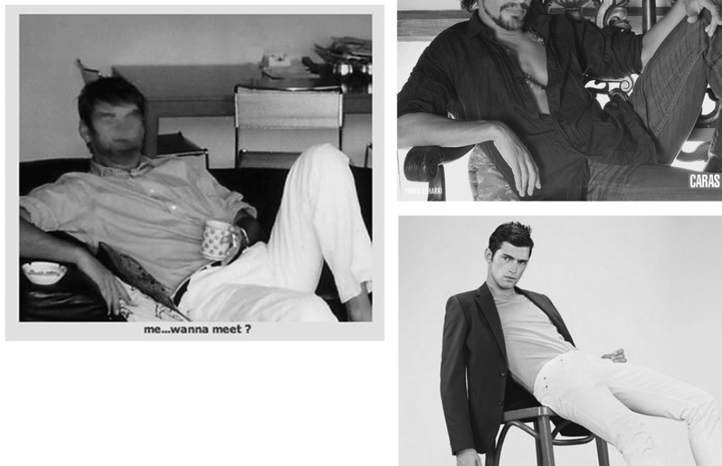
Lámina 5. Presentación viril y relajada de la persona. Las fotos corresponden a un perfil de Gaydar cuyo autor eligió un nombre similar a nordic-arg y se definió como “an easy going guy”, el galán argentino Pablo Echarrí en la edición de la revista local Caras de abril de 2006, y la campaña publicitaria primavera-verano 2013 de Hugo Boss . 25

Así, entre el recurso a fórmulas representacionales y la puesta en escena de valores tradicionalmente asociados a la virilidad y a ciertos estilos de vida, el uso dado por los sujetos de mi reflexión a las fotografías real o pretendidamente personales da cuenta del aprovechamiento del valor textual e intertextual de la representación naturalista, que ha constituido el objeto de la reflexión de autores con especificidades disciplinares tan diversas como los ya citados Warburg, Gombrich y Calabrese, o Sigmund Freud (2003 [1914]), y Mary-Lousie Pratt (1997). Remite, al mismo tiempo, a la observación de Cicerón que abre este artículo, acerca de que “las imágenes se parecen mucho a las tablillas de cera o a papiros. Las imágenes ( simulacris ) se parecen a las letras ( litteris ). La disposición y el orden de las imágenes se parecen a la escritura” (citado por Quignard, 2005: 110).