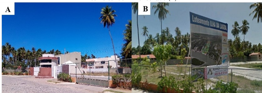
Figura 3 A e B – Residencial Ilha da Lagoa na Praia do Saco, como loteamento em 2012 (A) e em 2018 como condomínio fechado (B)