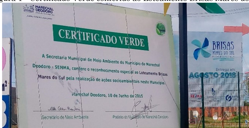
Figura 1 - Certificado Verde conferido ao Loteamento Brisas Mares do Sul