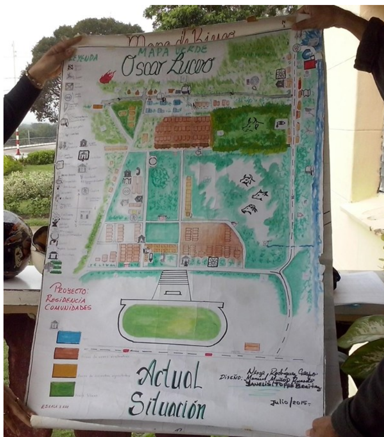
Figura 1. Mapa de riesgo diseñado por pobladores de la comunidad Oscar Lucero.