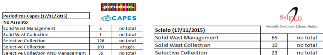
Figura 1 - Buscas de palavras chaves nos periódicos CAPES e Scielo.

Em busca realizada nas plataformas Capes (Coordenação de Aperfeiçoamento de Pessoal de Nível Superior) e SciELO ( Scientific Electronic Library Online ), em novembro de 2015, mostra que os temas gestão e gerenciamento de resíduos vem sendo objeto de estudo. Durante as buscas foram utilizadas as palavras chave: Solid Wast Managment, Solid Wast Collection, Selective Collection . No portal Capes foram encontradas 126 publicações no geral contendo o tema Coleta Seletiva, enquanto no site da Scielo foram encontradas 23 publicações, conforme ilustrado na Figuras 1. Já o tema Gestão de Resíduos Sólidos foi encontrado 2 vezes como assunto nos periódicos Capes, enquanto na Scielo foi encontrado em 65 publicações.