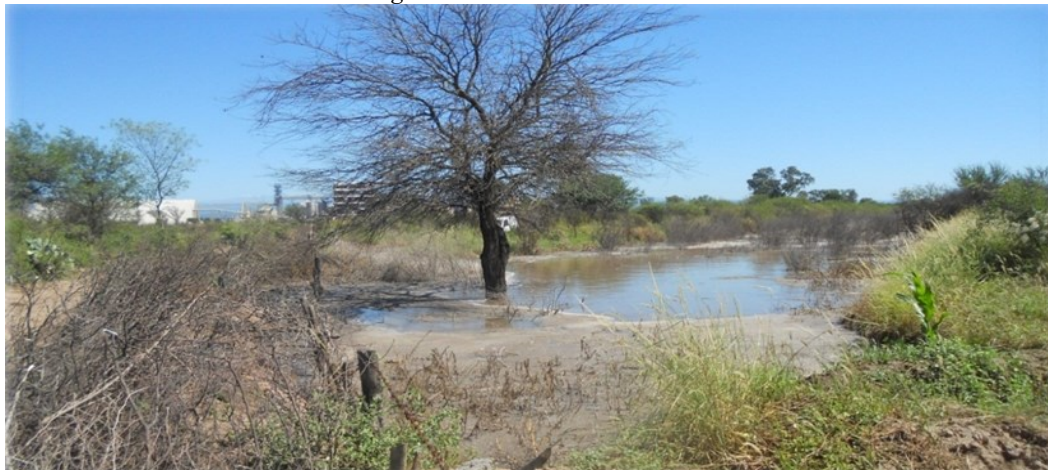
Imagen 1: Conflicto con vecino.

Fuente: archivo personal, marzo de 2012. La imagen refleja la medida adoptada por un vecino de la planta de biodiesel, al que el canal a cielo abierto le atravesaba su campo.