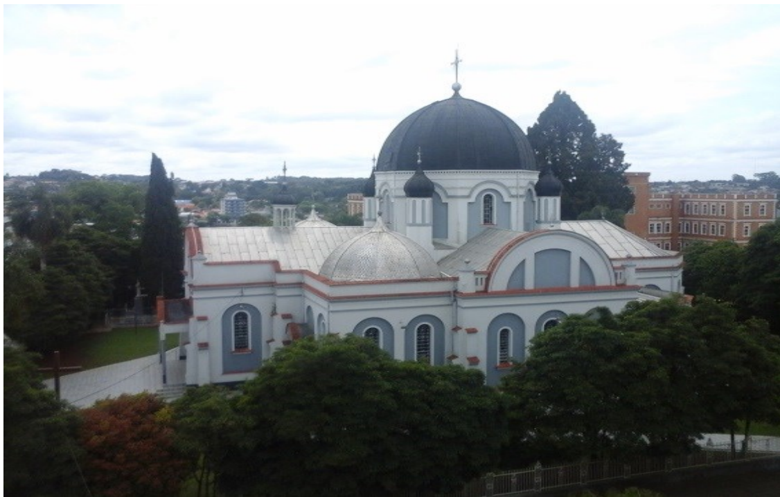
Figura 2 - Igreja Matriz de São Josafat, Prudentópolis- PR, 2017