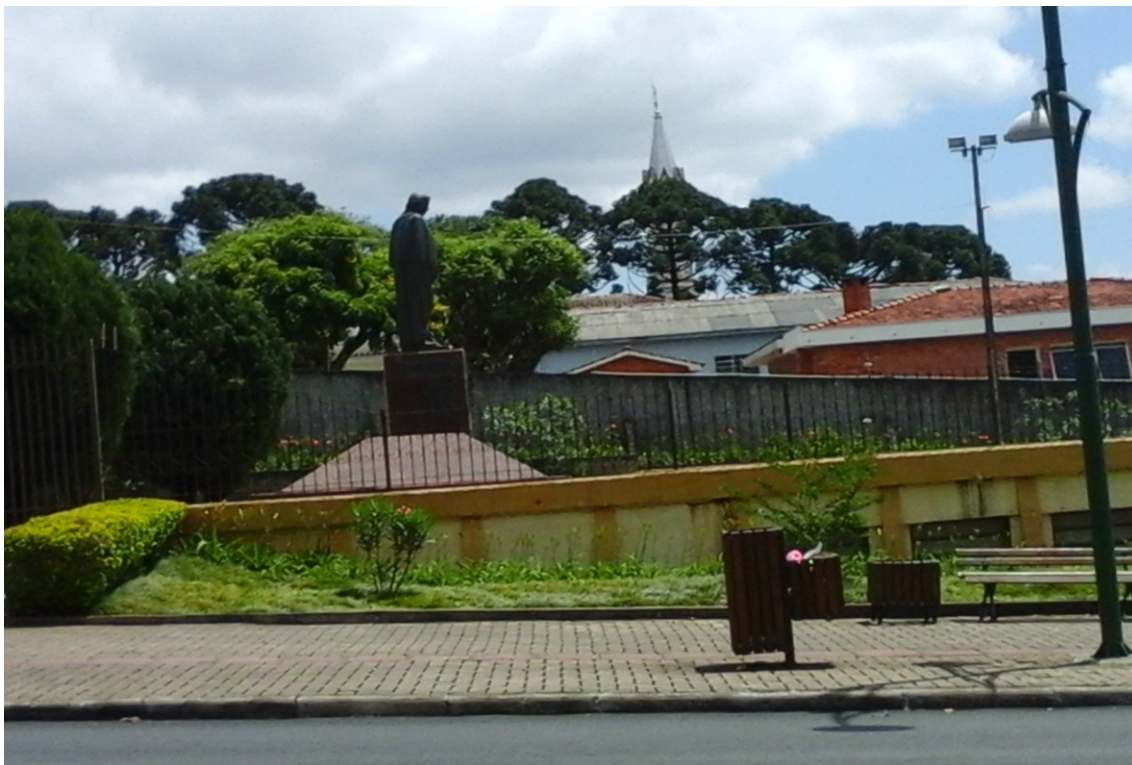
Figura 3 - Memorial Taras Chevtchenko, Prudentópolis-PR, 2017