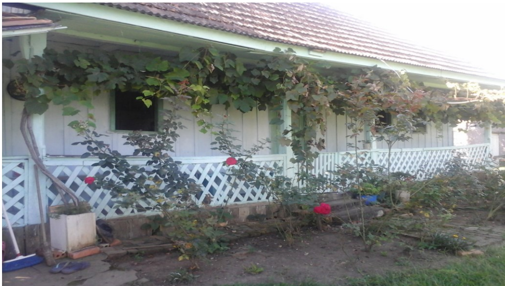
Figura 5 - Casa típica ucraniana em Prudentópolis, 2017