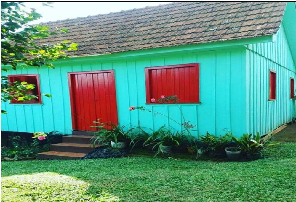
Figura 4 - Casa típica ucraniana em Prudentópolis, 2017