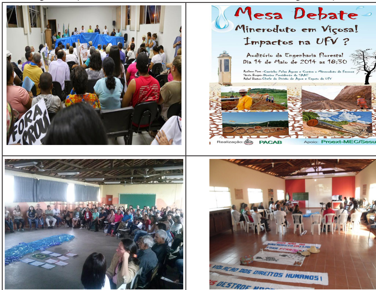
Figura 2 – Ações de resistência contra o mineroduto da Ferrous na microrregião de Viçosa