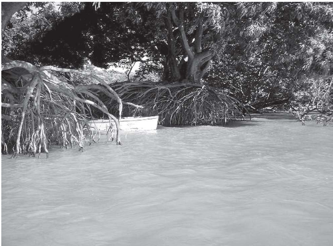
FIGURA 2: Erosão verificada nas costas da ilha Apipé Chico em março de 2003.

Paraná que se registran en esta zona... Entre los días domingos y lunes de cada semana, las variaciones de alturas de agua indicadas son, en promedio, de unos 0,60 m, (ocurriendo) en muy pocas horas de las mañanas de los días lunes (MUNICIPALIDAD DE ITUZAINGÓ, 2003, p. 1).