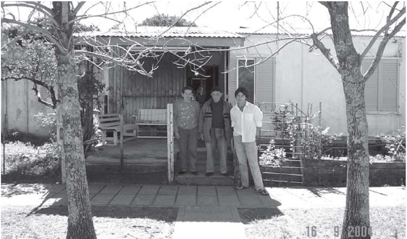
FIGURA 3: Casa de família reassentada do bairro 15 Viviendas de Ituzaingó .