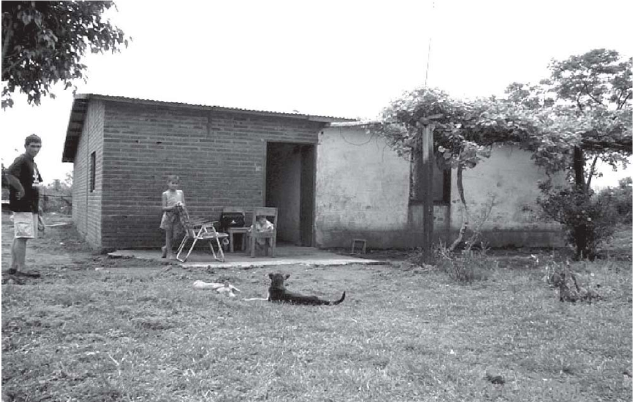
FIGURA 4: Casa de família reassentada da localidade de Santa Tecla , distante 32 km de Ituzaingó .