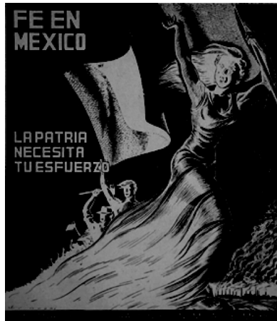
Extraída de Cuadernos Americanos, año VII, número 5.

mente plasmado en los discursos de los gobernantes de la época, y ha sido analizado por muchos autores, pero lo que quiero mostrar aquí son las representaciones de ese Imaginario en ejemplos muy claros en las páginas de Cuadernos Americanos . No sólo en artículos, donde se sostiene que México o se desarrolla o se hunde, y se proponen medidas concretas de política económica como el aumento de la tributación, el control salarial y de la paridad monetaria (Carrillo Flores, 1948), sino también en imágenes: un anuncio gubernamental que se repite en varios números muestra a una figura femenina, alta, delgada, blanca y rubia en actitud de avance, fuerte e impetuosa, enarbolando la bandera mexicana.