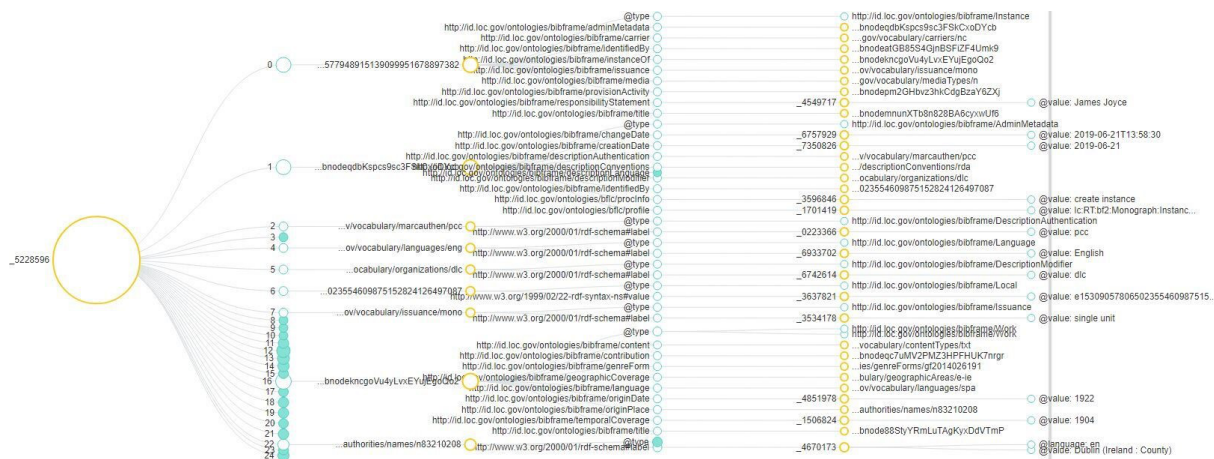
Figura 2. Visualización en modalidad de grafo de la instancia Ulises de James Joyce, desarrollada mediante BIBFRAME Editor.

En la Figura 2 puede apreciarse un ejemplo de la descripción efectuada al libro impreso de “Ulises” de James Joyce. Esta descripción ha generado una visualización en forma de grafo de la instancia del recurso. El reto principal de este tipo de visualización consiste en ofrecer un método de acceso y recuperación visualmente atractivo e intuitivo para el usuario final.