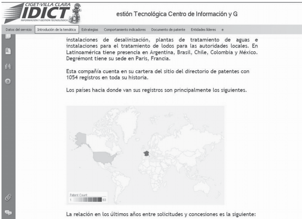
Figura 3. Herramienta para visualizar la información.