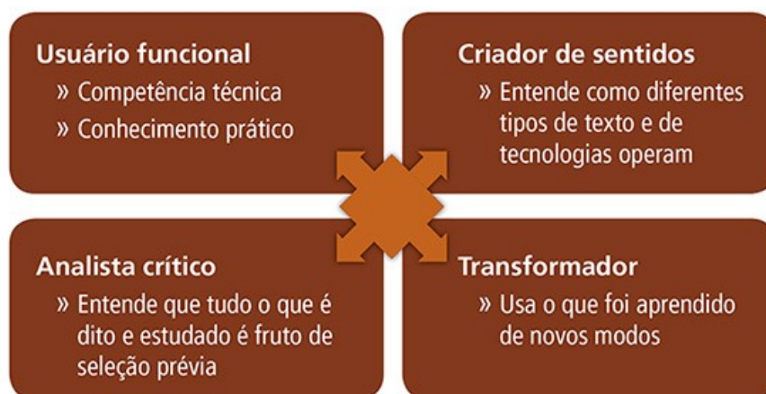
Diagrama proposto pelo Grupo de Nova Londres.

Na concepção dos Multiletramentos, propõe-se formar um usuário funcional, que tenha competência técnica, que entenda como diferentes tipos de texto e tecnologia operam, que tenha criticidade e que seja capaz de promover transformações (ROJO, 2012). O diagrama abaixo (Figura 1) evidencia esses princípios.