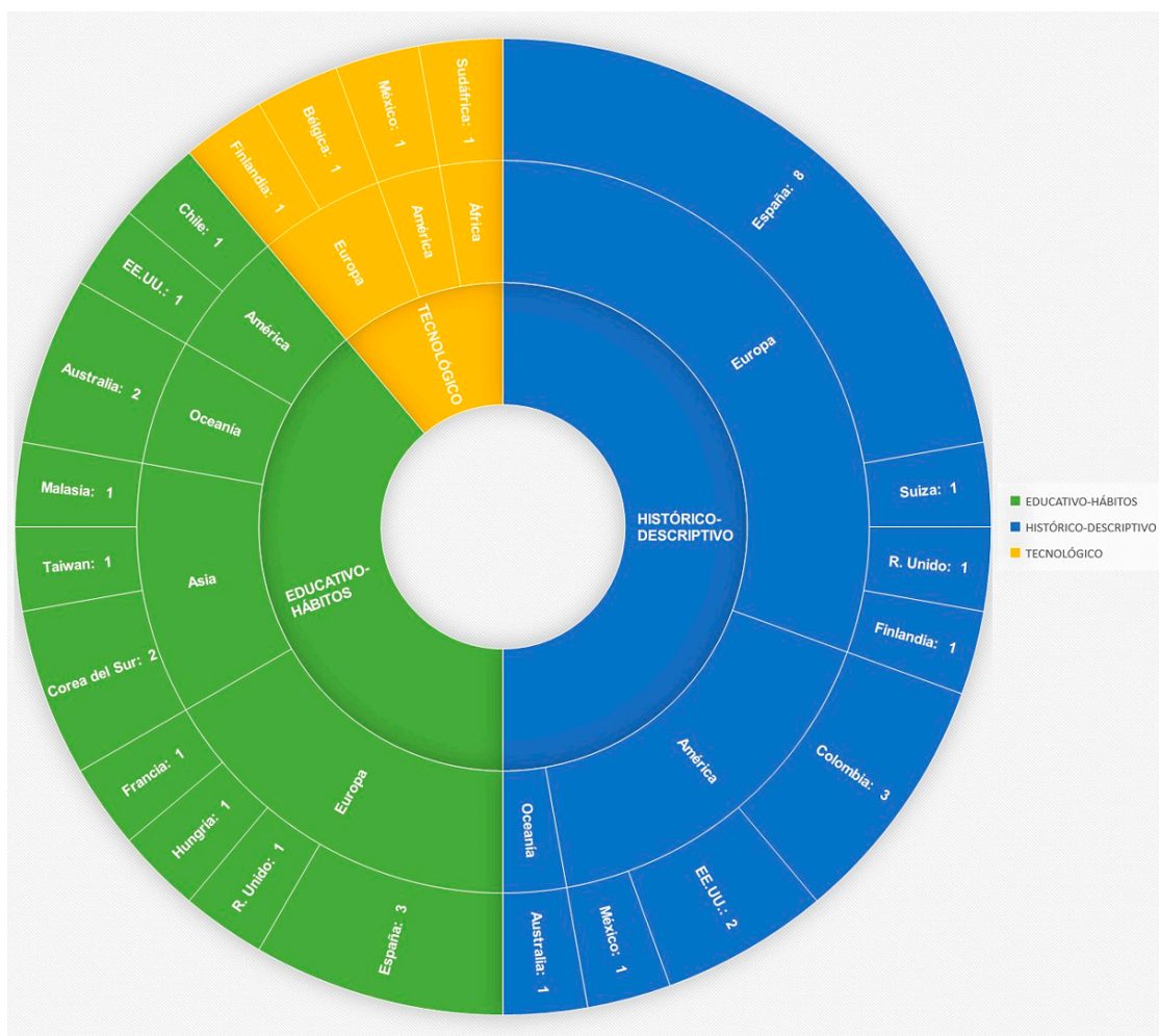
Figura 3. Origen geográfico de las autorías según el ámbito de estudio.