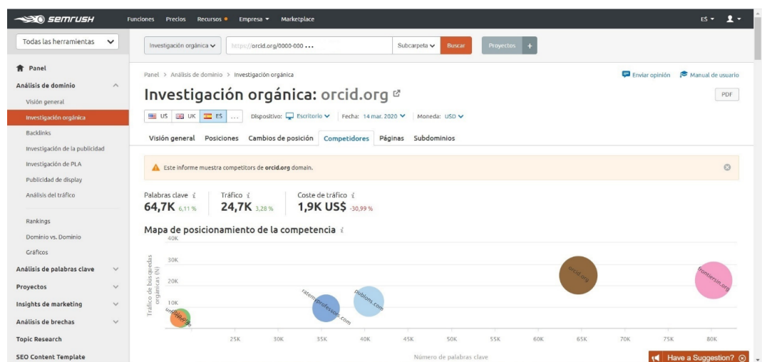
Figura 4. Principales competidores de ORCID en dato SemRush. Fuente: propia (segundo trimestre de 2020).