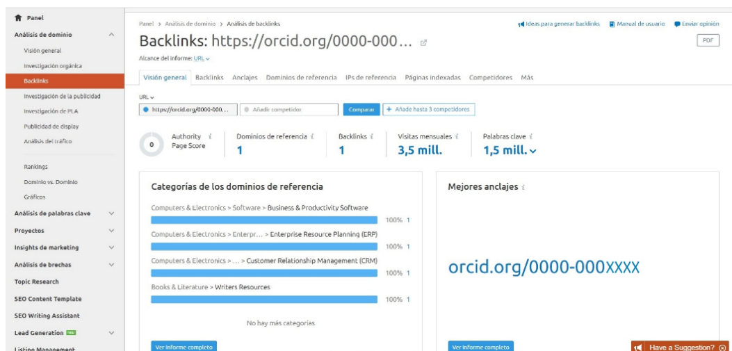
Figura 2. Datos de tráfico del perfil analizado en ORCID.

Fuente: propia (segundo trimestre de 2020).