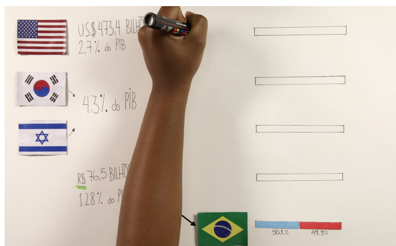
Figura 4. Cena do vídeo “Panorama mundial dos investimentos em pesquisa e desenvolvimento”.

Levando em consideração a virtual capacidade dos recursos multimídias e, nomeadamente, do audiovisual para o conteúdo didático, também foram criados vídeos para os módulos. Para tanto, os envolvidos na criação do curso tiveram de roteirizar, produzir, gravar e editar o conteúdo audiovisual. Para os vídeos, foi usada uma técnica chamada de overhead shooting, na qual a câmera posiciona-se acima de uma pessoa, de forma que aparece somente o braço dela, normalmente desenhando. Parte dos vídeos foram produzidos no contexto da bolsa 2016/25810-3, sobre o uso da imagem complexa na difusão científica (EBOHON; PESCHANSKI, 2017). Um deles, “O que é pesquisa e desenvolvimento”, foi feito com o Videoscribe, um software que permite a produção audiovisual sem que haja uma gravação de fato. Ou seja, o programa usa gravações prévias de overhead shooting, que veem junto com o programa, de uma pessoa escrevendo ou desenhando palavras ou imagens de um banco de dados também do programa. Contudo, o processo é demorado e o resultado, um tanto quanto artificial. Depois, teve início a gravação de vídeos propriamente dito com a técnica de overhead shooting, como no caso do vídeo “Panorama mundial dos investimentos em pesquisa e desenvolvimento” (Ver Figura 4).