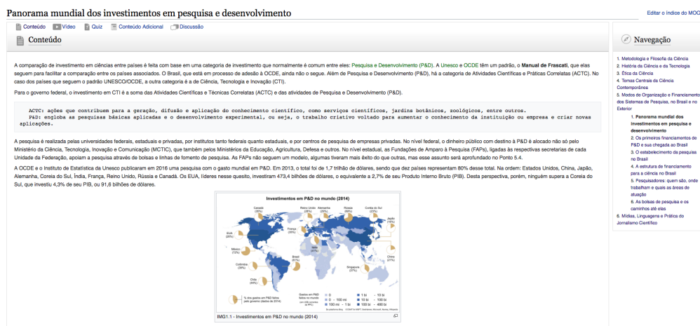
Figura 2. Página da aula inicial do quinto módulo “Modos de Organização e Financiamento de Pesquisas no Brasil e no Exterior”.