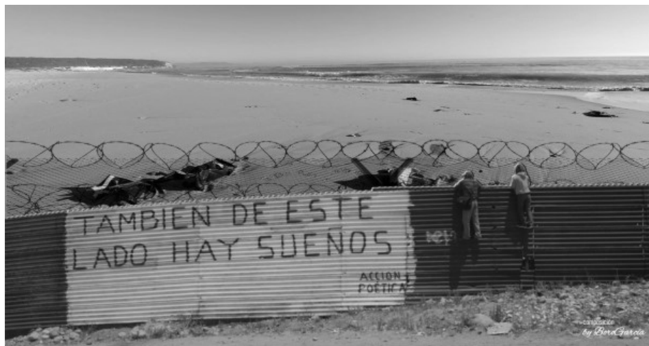
Figura 3. Mural "También de este lado hay sueños".