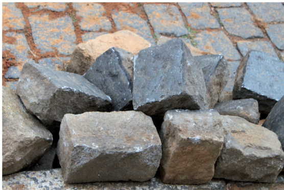
Paralelepípedos, São João Del Rei, MG

Todavia, antes de passarmos à distinção heideggeriana entre meras coisas, utensílios e artefatos, imaginemos já alguns deslocamentos possíveis, a partir dos quais os paralelepípedos perderiam sua função utensiliar: por exemplo, na situação em que fossem retirados das ruas e levados a uma sala de exposição, instalados fora de alguma funcionalidade.