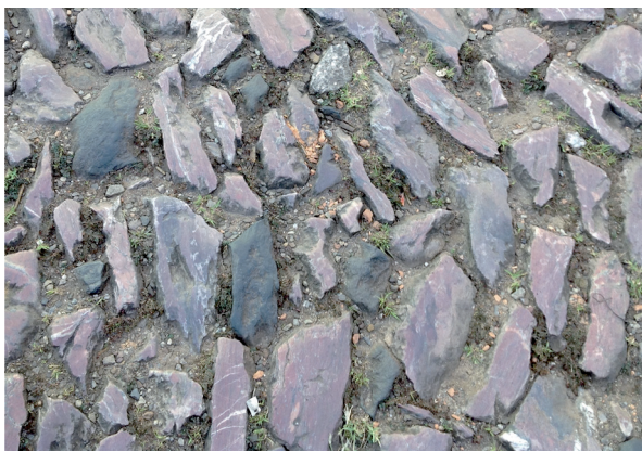
Rua de paralelepípedos, Sabará, MG