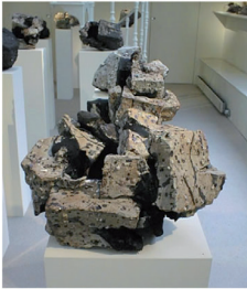
Claudi Casanovas Block no. 17, cat 9 36 x 24 x 27 cm