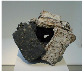
Claudi Casanovas Block no. 48, cat 14 23 x 28 x 27 cm