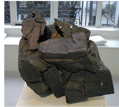
Claudi Casanovas Block no. 59, cat 1 32 x 28 x 21 cm

Obras de Casanovas, como Blocks e Memorial als Vençuts , trazem objetos de cerâmica como se estes remetessem à matéria da qual provêm: formas orgânicas inacabadas, plenas de rachaduras ou fraturas, contornos indefinidos ou dissonantes. É como se o artista não somente transformasse a matéria, mas a expusesse a uma tessitura de riscos, incisões, cortes, que lhe devolvesse algo de próprio. É como se a obra despertasse possibilidades dormentes, possíveis mutações geológicas que encontram, através do artista, algumas de suas efetivações. Nesse sentido, as fraturas e tonalidades advindas da argila na queima menos a elevariam a uma segunda natureza, a uma condição de obra