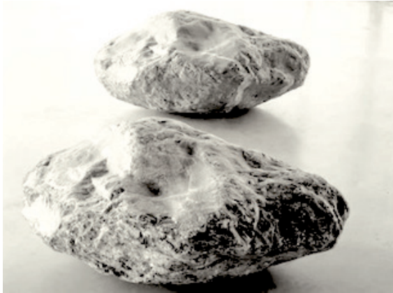
Giuseppe Penone, Essere fiume , 1981 Duas pedras, 40 x 40 x 50 cm

Ao comentar esse trabalho, Didi-Huberman, no texto Ser crânio: lugar, contato, pensamento, escultura , insinua que são duas temporalidades aí presentes: “[...] um encontro em um mesmo lugar de duas temporalidades profundamente diferentes (aquela, geológica, da pedra do rio e esta, artística, da pedra da montanha).” (DIDI-HUBERMAN, 2009, p. 53). Mais precisamente, Didi-Huberman adverte que são duas pedras encontradas na natureza e não somente a primeira, pois a segunda fora encontrada numa montanha próxima ao rio, antes de o artista mimetizar na escultura o tempo geológico da primeira. A esse tempo geológico Didi-Huberman, citando Penone, alude através de verbos de ação como: “as pedras se chocam, explodem”, “a água lava, leva a poeira de pedra, pule o material.” (2009, p. 46). É como se o escultor se aproximasse desses procedimentos, já que, como ressalta Penone, no título que deu à obra, há que ser rio para esculpir a pedra: “Para esculpir a pedra de verdade, tem-se que ser rio.” (PENONE apud DIDI-HUBERMAN, 2009). O artista, no esculpir, torna-se, desse modo, o sujeito implícito a estes infinitivos: lavar, levar a poeira, polir. 5 Como sugere Didi-Huberman, na primeira pedra, tem lugar uma “ontogênese material da forma”, enquanto, na segunda, “[...] a escultura tem então valor de uma anamnese em atos, em pedra, em tempo presente.” (DIDI-HUBERMAN, 2009, p. 47, 54). Essa anamnese, que não é memória de si, é uma memória suposta acerca dos processos, lentos e imperceptíveis, de