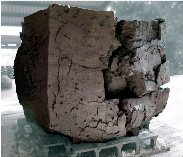
Claudi Casanovas, Memorial als Vençuts , 2004 (criado num período de dois anos a partir de 15 toneladas de argila e envolto por uma cápsula de concreto)

artística enquanto objeto de cultura, do que lhe restituiria a um espaçamento próprio, anterior aos significados e individualizações.