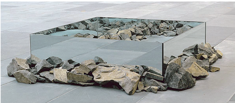
Robert Smithson, Rocks and mirror square II

Para os artistas vinculados à Land Art (tendência que afirma o vínculo entre natureza e arte) 6 , os deslocamentos, desgastes e fragmentações dos materiais ditos naturais foram realçados, dando a ideia de que, ou as obras são sem referente, ou esse referente diz respeito tão somente aos materiais naturais que precisamente coincidem com os materiais expostos. Para tais artistas, a separação entre materiais ditos naturais e materiais não naturais permaneceu como um critério para diferenciar o que se privilegiaria em arte. Nesse caso, pedras como tais somente podem ser pedras de natureza.