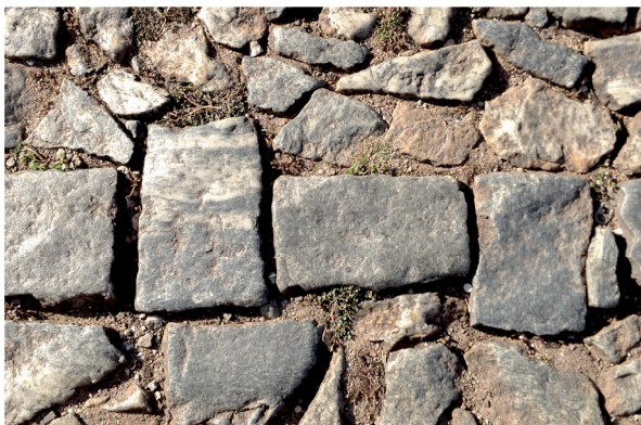
Rua de paralelepípedos, Sabará, MG

Mas eu gostaria de começar de modo situado, mostrando de onde essa questão partiu.