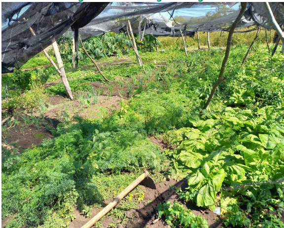
Figura 3 – Horta Agroecológica

Uma outra possibilidade de atividades ligadas a passeios são as estradas dentro do assentamento, que proporcionam paisagens com muitas espécies da vegetação local, o que reduz o calor, além de servir de contato com a natureza do assentamento e a fauna e flora pantaneira, além de contato com a história do assentamento. Ademais, proporciona aproximação com as rotinas da comunidade. Esses aspectos foram identificados nas pesquisas de Campos e Silva (2020) e de Oliveira, Diógenes e Almeida (2021). As Figuras 3 e 4, a seguir, são fotografias de locais que possibilitam passeios.