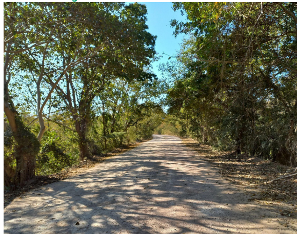
Figura 4 – Estrada do assentamento