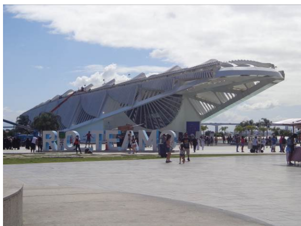
Figura 13 - Museu do Amanhã ao fundo com a hashtag "Rio, Te amo" em primeiro plano.

O Museu do Amanhã, projetado pelo espanhol Santiago Calatrava como um edifício futurístico, teve sua obra estimada em um valor de R$ 308 milhões, sendo R$ 215 milhões obtidos com os recursos da venda dos Cepacs e o restante de patrocínio (Site BBC Brasil, 2015). A prefeitura, ao invés de promover um concurso público para decidir o escritório que seria responsável pelo projeto, optou por formalizar a parceria com a Fundação Roberto Marinho – a quem delegou a contratação do projeto – e o escritório espanhol Santiago Calatrava Architects & Engineers (Rheingantz, 2017).