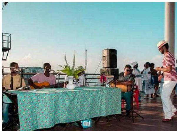
Figura 7 - Samba Providência sendo realizado na estação do teleférico no alto da Providência.

Assim, o teleférico pode ser visto como um actante que nos permite ampliar o entendimento sobre as relações que ocorrem na Providência e sobre os efeitos destes agenciamentos. Se considerarmos para além de seus atributos técnicos e/ou formais, percebemos que as ações que levaram à sua paralização estão atreladas às performances do governo, cujo interesse foi instalar o equipamento para facilitar o acesso à Providência durante o período dos megaeventos, como a Copa do Mundo de 2014 e as Olimpíadas de 2016.