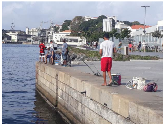
Figura 11 - Pesca sendo realizada nas margens da Baía de Guanabara, na Praça Mauá.

Apesar disto, a atual configuração da Praça Mauá tem favorecido a conexão e o contato com a Baía de Guanabara, cujo nível de poluição segue polêmico. Mesmo com a contaminação da água, eventualmente são realizadas atividades, como a pesca (Figura 11) e o uso da baía para mergulho (Figura 12). Estas práticas, por contradizerem as expectativas e intenções do projeto Porto Maravilha , podem ser vistas, para além das ações de lazer, como ações de resistência. Também colocam em questão a ideia de a cidade do Rio de Janeiro tentar seguir práticas globais, sem considerar sua condição local, desprezando os possíveis usos que seriam feitos dos locais ditos “revitalizados”. Cria-se a partir daí um jogo dinâmico de resistências e capturas.