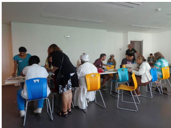
Figura 15 - Grupo Café com Vizinhos realizando atividade sobre a Zona Portuária.

No caso do MAR, a partir de nossa experiência em campo, é possível observar que há uma interação ainda maior com a região por conta do Programa Vizinhos do MAR , que realiza atividades, articulando os interesses do museu, enquanto instituição, aos interesses dos moradores cadastrados no programa. Como efeito, surgem práticas, como Café com Vizinhos (Figura 15), Conversa de Galeria , curso Ofício e saberes da Região , cujas atividades colocam os moradores como atores efetivos do processo de construção de conhecimento sobre a Zona Portuária. Para além da ideia de ícone da revitalização, fica clara a performance do museu como um actante que – a partir de seus movimentos e das redes que o constituem – faz alianças, interfere na dinâmica do lugar e de outros actantes, ao mesmo tempo em que se transforma pelas ações que são praticadas em seu interior. Reconhecemos, portanto, que outras percepções e performances de realidades sobre estes museus são possíveis.