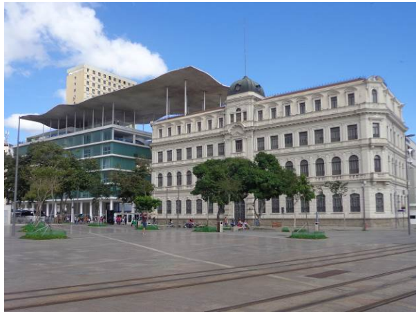
Figura 14 - Museu de Arte do Rio, formado pelo palacete Dom João VI e a Escola do Olhar.

obtem uma carteira que dá acesso irrestrito aos museus para participarem de suas diversas atividades educativas e culturais.