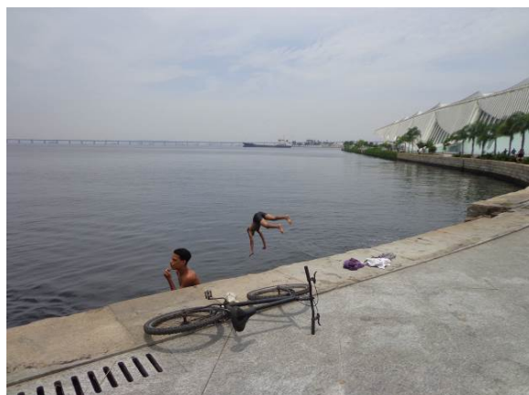
Figura 12 - “Competição de mergulho” realizada por jovens moradores da Zona Portuária.