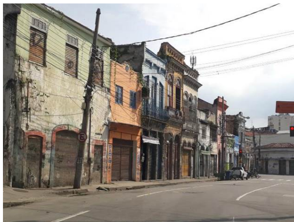
Figura 4 - Trecho da Rua Sacadura Cabral entre o Cais do Valongo e a Praça da Harmonia.

Além disso, o projeto Porto Maravilha , embora tivesse como uma de suas diretrizes realizar ações de melhoria, como a implementação de creches, escolas, unidades de pronto atendimento e habitações de interesse social, logo no início da operação, moradores do Morro da Providência tiveram suas casas destruídas e foram alvo de remoções (Figura 5) devido a instalação do teleférico, inaugurado em julho de 2014.