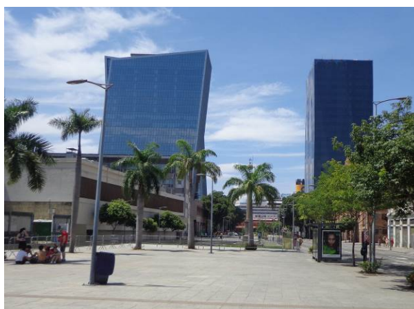
Figura 1 - Praça Jornal do Comércio, onde encontra-se o Cais do Valongo, considerado Patrimônio da Humanidade pela UNESCO, e ao fundo o edifício Vista Guanabara e a nova sede da L'Oréal, construídos com a aquisição dos CEPACs.

Entretanto, a criação dos CEPACs aponta para uma controvérsia relacionada com o projeto, gerando opiniões distintas sobre os benefícios proporcionados para a área. Em vias, como a Avenida Francisco Bicalho, podem ser construídas edificações de até 150 metros de altura, enquanto na Avenida Rodrigues Alves, próximo à Praça Mauá, as construções podem chegar até 90 metros de altura (Figura 1).