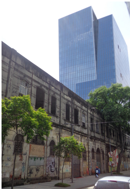
Figura 2 - Edificação em estado precário em contraste com o edifício Vista Guanabara.

Em meio às múltiplas realidades performadas, o que se nota na região é que houve investimento apenas em uma parte do porto, como a Orla Conde e a Praça Mauá, negligenciando e excluindo diversos outros locais. Na rua Sacadura Cabral, por exemplo, há no mínimo duas versões possíveis do Porto Maravilha . No trecho da rua que liga a Praça Mauá até o Cais do Valongo, alguns sobrados foram restaurados – fruto das parcerias entre o poder público e os proprietários dos imóveis (Figura 3). Já no trecho que vai do cais até a Praça da Harmonia, diversas edificações estão em estado de conservação precário (Figura 4).