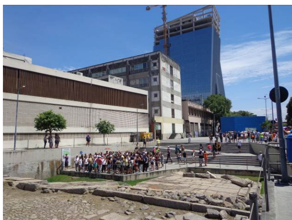
Figura 16 - Grupo de visitantes conhecendo a história do Cais do Valongo.

Além disso, no dia 1º de agosto de 2017, Antonio Pedro Índio da Costa, atual Secretário de Urbanismo, Infraestrutura e Habitação, assinou a Resolução nº 28 de 28 de julho de 2017 (Rio de Janeiro, 2017), que proíbe o tombamento das áreas definidas na Lei Complementar Municipal nº 101/2009. Um dos motivos é que o FIIPM, administrado pela CEF, investiu no porto adquirindo CEPACs, com recursos do FGTS e o recurso utilizado presume garantia de retorno do investimento para o próprio FGTS. Por isso, as novas demandas de tombamento na região serão avaliadas previamente pelo FIIPM e pela CDURP.