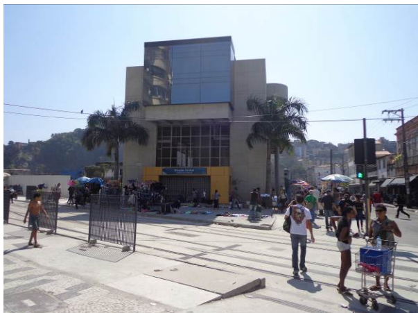
Figura 6 - Estação do teleférico, próximo à Central do Brasil, desativada.

incluindo a construção das estações, a montagem das torres, o remanejamento da rede de energia e a implantação de vias de serviço (Site Porto Maravilha, 2015).