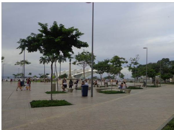
Figura 8 - Praça Mauá remodelada com a presença de pessoas.

Praça Mauá. Estas são ações que visam dar suporte e manter ativas suas estruturas, como, por exemplo, o projeto Porto Maravilha Cultural , que estimula visitas aos lugares através do turismo, reacendendo a imagem dos locais, antes esquecidos.