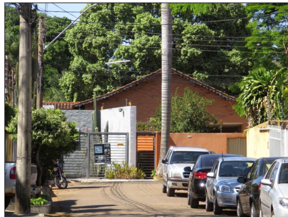
Figura 3 - Cul-de-sac com atual entrada principal das casas no Setor Sul de Goiânia e originalmente destinado à entrada de serviço. Ao fundo nota-se o parque no interior da superquadra Fonte: acervo do autor (2014).

pelos próprios moradores, é tido como um hobby e um modo de elevar o espírito, e para nós, brasileiros, herdeiros de uma sociedade escravocrata, o serviço de jardinagem, por ser um trabalho braçal, envilece quem o executa (Paula, 2008, p. 170). Com isso, nem a municipalidade nem os proprietários ou os empreendedores se responsabilizaram por aqueles espaços livres no interior das quadras, que acabaram sendo re-parcelados (cf. Bacelli, 1982). E, por fim, os lotes residenciais foram murados, restando apenas as ruas sinuosas arborizadas e as substanciais áreas livres dos lotes como aspectos do layout original de bairro jardim-inglês.