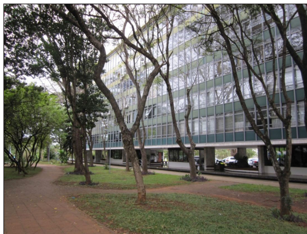
Figura 4 - Interior de superquadra de Brasília

De fato, a concepção da cidade funcional requeria superfícies verdes, de modo a implantar edificações isoladas, de alta densidade, em amplas áreas de vegetação espontânea. De acordo com a Carta de Atenas, as aglomerações urbanas tenderiam a tornar-se cidades verdes e, contrariamente ao que ocorria nas cidades-jardins, as superfícies verdes não seriam compartimentadas em pequenos elementos de uso privado, mas consagradas ao desenvolvimento das diversas atividades comuns que formavam o prolongamento da moradia (Le Corbusier, 1993, item 35). Com efeito, a relação existente na cidade tradicional entre maciços edificados e os espaços livres emoldurados por eles foi