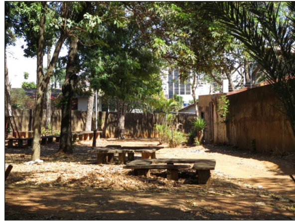
Figura 2 - Interior de superquadra no Setor Sul de Goiânia, para o qual deveriam estar voltadas as fachadas das residências adjacentes

Com outras motivações, uma deformação semelhante já havia sido verificada na ocupação do Jardim América, o primeiro bairro-jardim de São Paulo, projetado pelo urbanista inglês Richard Barry Parker em 1917. De acordo com Rego (2014), houve inicialmente certa dificuldade na venda dos lotes, na medida em que a espacialidade aberta da vizinhança, criando uma paisagem pitoresca sem muros altos e apenas com cercas vivas baixas (bastante apreciada por norte-americanos e britânicos), conflitava com as noções brasileiras de intimidade familiar (Paula, 2008, p. 118; Wolff, 2001, p. 84). Depois houve a questão da responsabilidade dos custos e da manutenção dos jardins comuns nos espaços livres no interior das quadras, pois para os ingleses (autores do modelo garden city ), o cuidado de um jardim, feito tradicionalmente