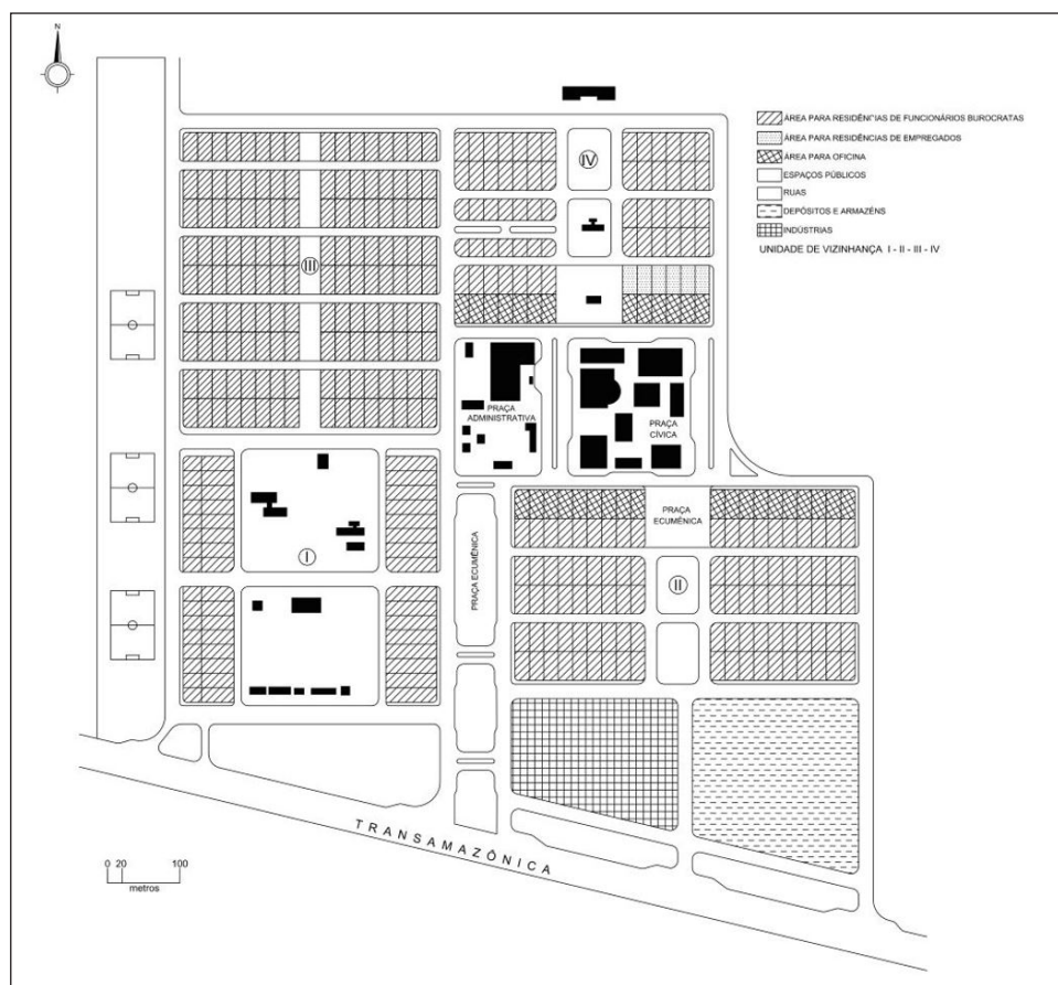
Figura 5 - Planta inicial de Brasil Novo. Note-se a conformação da superquadra em torno do edifício escolar, com comércio e serviços deslocados.

A agrópolis (Figura 5) configurava um centro urbano agroindustrial com influência socioeconômica, cultural e administrativa sobre uma área de aproximadamente 10 km de raio, na qual podiam estar situadas de 8 a 12 agrovilas. Além da estrutura básica de uma agrovila, a agrópolis contava também com ensino secundário, comércio diversificado, cooperativa, pequenas agroindústrias, ambulatório médico-odontológico, cemitério, centro telefônico, correio e telégrafo. Uma agrópolis devia comportar de 300 a 600 famílias – ou seja, uma população entre 1500 e 3000 habitantes (Rego, 2015, p. 93).