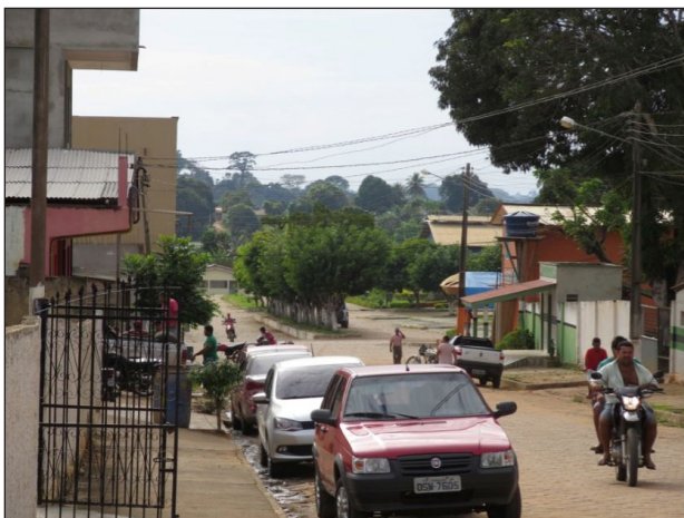
Figura 9 - Ruas desconexas em Brasil Novo