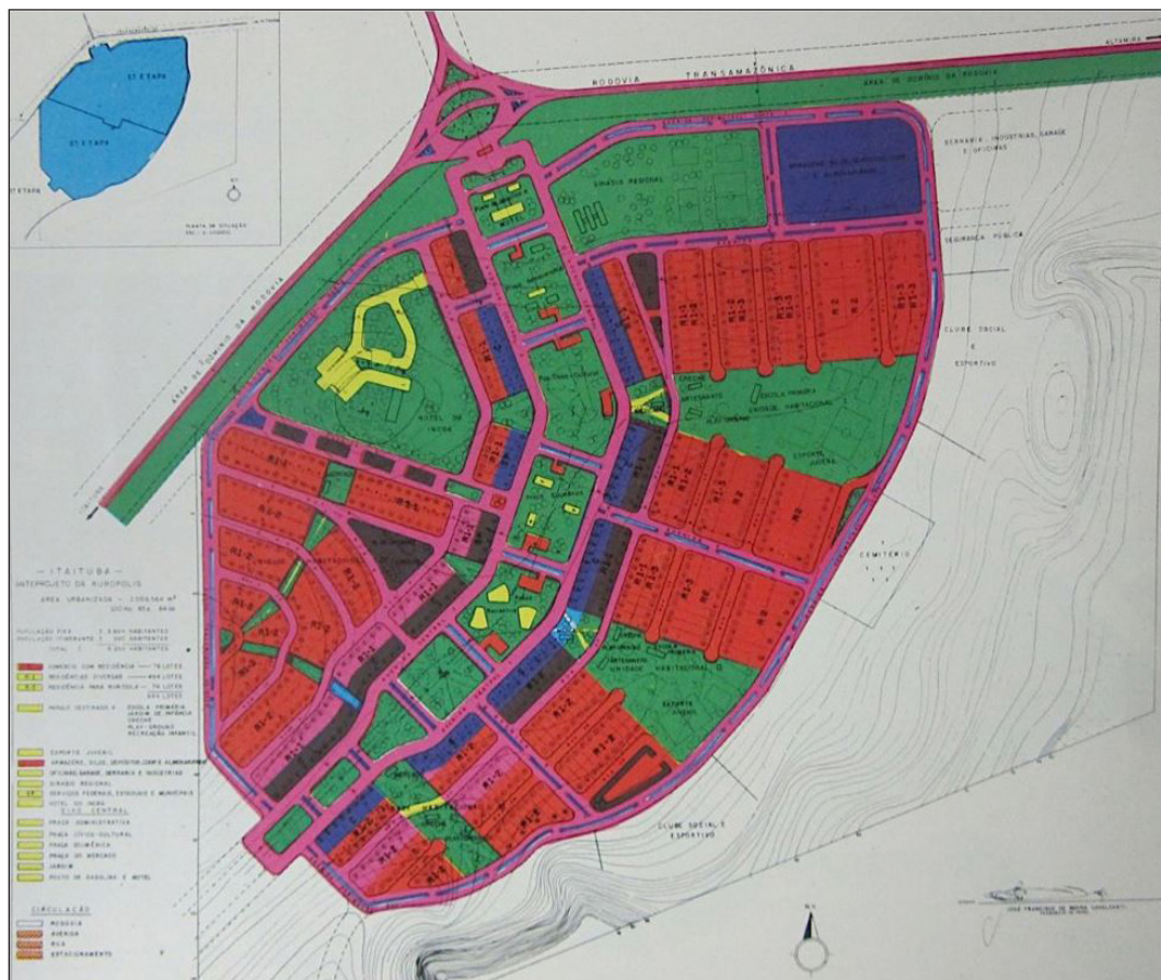
Figura 6 - Anteprojeto da Rurópolis, com destaque para uma unidade de vizinhança (note-se em vermelho as zonas residenciais entremeadas por espaço livre que contém a escola e, em azul e preto, as áreas comerciais e de serviços)

– e Rurópolis – fundada como tal no cruzamento da Transamazônica com a Cuiabá-Santarém – progrediram e emanciparam-se. Hoje, Brasil Novo tem aproximadamente 15.000 habitantes e Rurópolis, mais de 46.000 (IBGE, 2015). Agrovilas, agrópolis e rurópolis haviam sido traçadas de acordo com o ideário do urbanismo racionalista/funcionalista pós-Brasília e, desse modo, pode-se notar nos projetos de Brasil Novo e de Rurópolis o emprego de unidades de vizinhança, separação entre automóveis e pedestres na hierarquização viária (com vias principais, vias locais e vias de pedestres), cul-de-sacs , setorização e zoneamento funcional. Camargo conhecia as propostas de Perry, Stein e Wright (cf. Braga, 2011, p. 284, 285) e sua afinidade com o ideário do urbanismo moderno já podia ser percebida na proposta número 20 que ele apresentara no concurso do plano-piloto de Brasília; na verdade, a configuração do centro comercial da proposta que Camargo elaborou para a capital