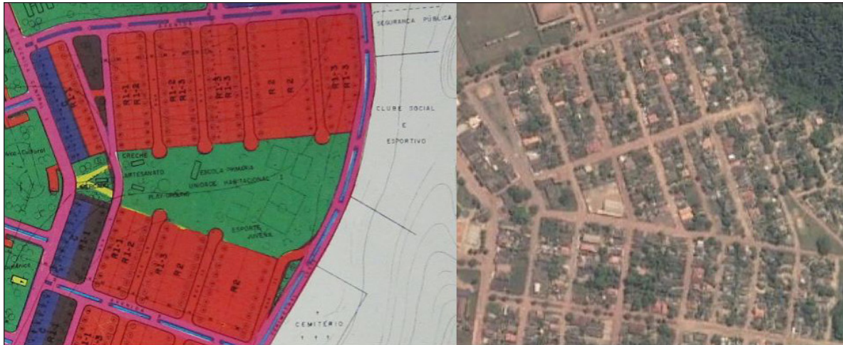
Figura 8 - Detalhe da forma urbana proposta para Rurópolis e imagem atual da mesma área, já com a unidade de vizinhança extinta e a área verde livre ocupada, refazendo um tecido urbano mais usual