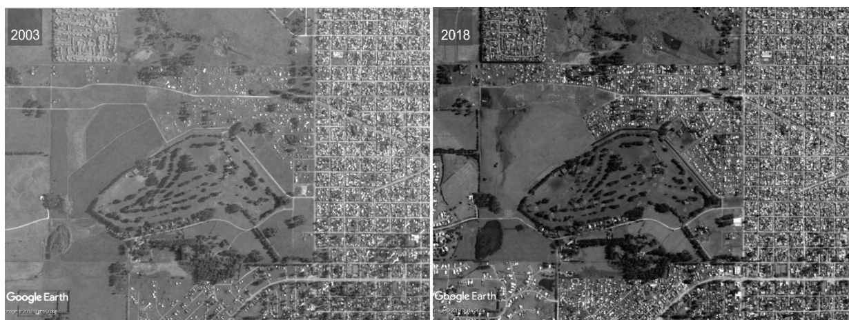
Figura 3 - Transformação da ocupação da área: 2003 e 2018.