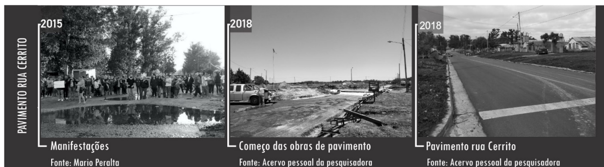
Figura 11 - Pavimentação da rua Cerrito.

A luta histórica que mantiveram ao longo dos anos resultou na pavimentação de sete quadras da Rua Cerrito, obra que foi iniciada em outubro de 2018. No entanto, a comunidade não se conformou com as sete quadras de pavimento que a obra pública conseguiu fazer. Em novas manifestações, continuaram exigindo que as demais ruas do bairro fossem consertadas e as sete quadras, acondicionadas, para evitar acidentes (Figura 11).