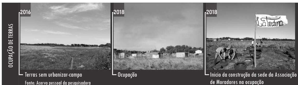
Figura 10 - Ocupação de terras.

Depois de rodadas de negociação com a entidade de moradores e representantes dos movimentos sociais se chegou ao entendimento de que os lotes que “deveriam” ser ocupados eram somente os privados. O dono da área estava disposto a negociar com a prefeitura. Apesar disso, meses depois, as áreas públicas foram ocupadas por mais de 40 famílias que começaram a construir barracos nos lotes anteriormente delimitados por cerca. Diante dessa situação, o presidente da associação de moradores e a agrupação política La trinchera decidiram ocupar uma área para assegurar a futura construção de equipamentos públicos. Uma sede da associação começou a ser construída na área ocupada, servindo para “delimitar território” e como laboratório de experiências de construção sustentável (Figura 10).