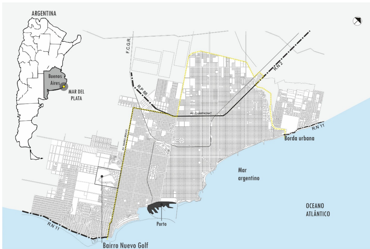
Figura 1 - Localização da cidade de Mar del Plata e do bairro Nuevo Golf.

O bairro Nuevo Golf surge no marco da “crise de dezembro de 2001”, na Argentina, que teve início no final da década de 1990, no contexto de uma longa recessão que desencadeou uma instabilidade humanitária, representativa, social, econômica, financeira e política. A temporalidade da crise, no entanto, abrange mais de duas décadas de aprofundamento da precarização das condições sociais. Isto acarretou, por um lado, altos níveis de desemprego e, por outro, diminuição dos serviços sociais devido à desintegração do chamado Estado de Bem-Estar (Clichevsky, 2000). A natureza estrutural dessa recessão aprofundou as fraturas sociais, a desigualdade e a pobreza, obrigando as famílias a implementar diferentes estratégias de vida para enfrentar novas situações (Rodulfo, 2007).