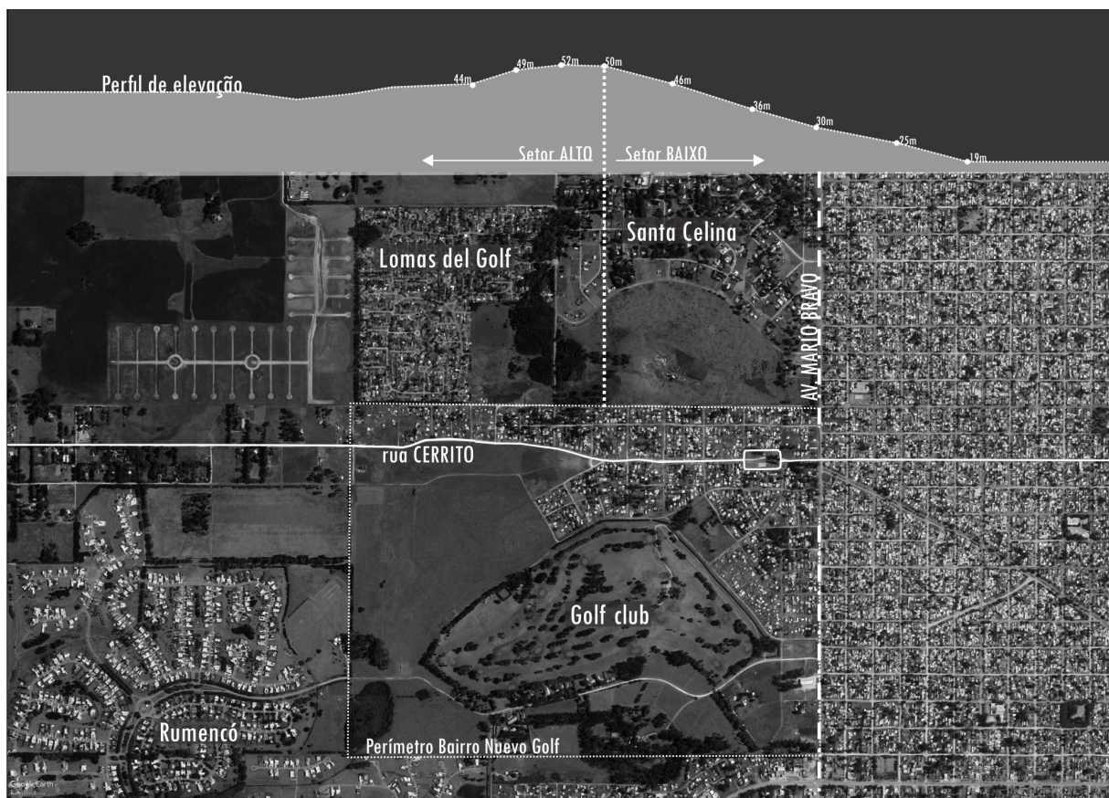
Figura 2 - Localização e relevo do bairro Nuevo Golf.