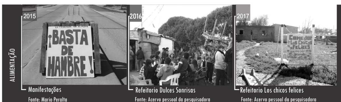
Figura 7. Alimentação.

Estamos aqui para ajudar, muitas pessoas passam fome. Já gastei o que ganhei hoje comprando as coisas que faltavam para o lanche, mas me sinto orgulhosa, porque eu fiquei com fome quando criança. Enquanto eu estiver viva, nenhuma outra criança vai passar fome (Andrea Mansilla, entrevista, 2016) (Figura 7).