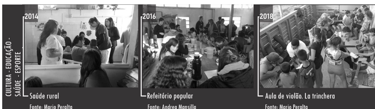
Figura 8 - Cultura, educação, saúde e esporte.

Diversas atividades são realizadas de modo autogestionário para oferecer cursos e oficinas gratuitas. Outras atividades propostas incluem programas estatais que fazem uso da associação de moradores e da Casa de Encontro Comunitário (CEC) Dulces Sonrisas como ponto de encontro aos habitantes do lugar (Figura 8).