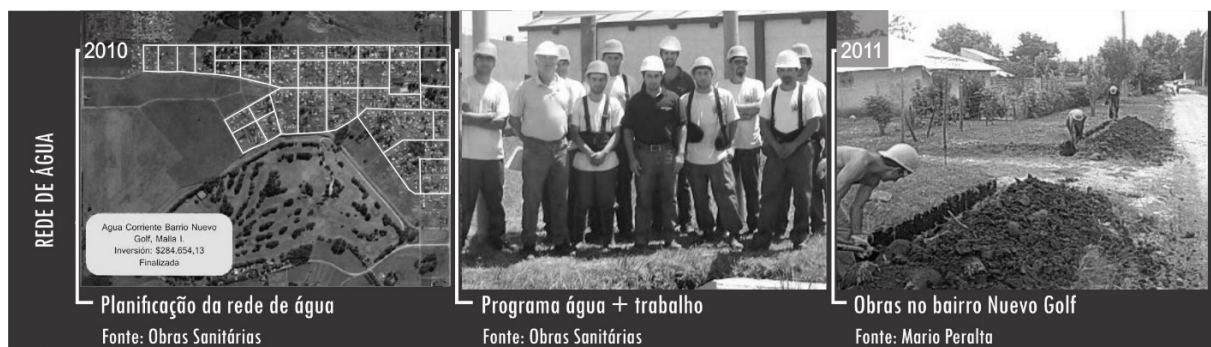
Figura 5 - Rede de água.