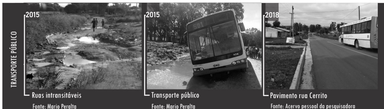
Figura 9 - Transporte público.

Além da necessidade de transporte, os moradores da região também demandam mais segurança, o que inclui iluminação pública e semáforos. Diante desses pedidos, a prefeitura instalou, no mesmo lote onde se localiza a associação de moradores, um posto de segurança policial (Figura 9).