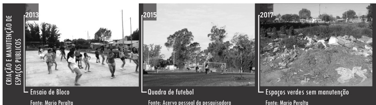
Figura 6 - Criação e manutenção de espaços públicos.

Em 2017, a associação de moradores começa a trabalhar com a Faculdade de Ciências Exatas (UNMDP), da disciplina de Biologia, num projeto de educação ambiental. As atividades começaram como oficinas informativas e educativas e logo se consolidaram com ações concretas no território — como a plantação de árvores nos espaços públicos. O levantamento de pontos de lixo no bairro também foi uma das atividades praticadas em conjunto com a associação de moradores, com o objetivo de melhorar a condição de poluições ambiental e visual que estes produzem (Figura 6).